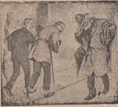
Profesorul de specialitate

cive e în culmea fericirii. De bucur'e se pleacă până la pământ și ar sta să-l sărute mâna. Dor n'o fac ceilalți, n'o face nici el.