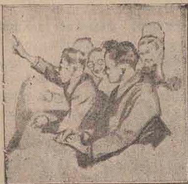
Sub impresia amintirii din liceu

Nu-i mirare deci că sârguincioasele colege sunt întâmpinate cu grațiosități nu prea măgulitoare de „vulpile bătrâne“. Balicul rămâne uluit în fața acestei delicatețe ironice debitate la adresa „sexului frumos“. El, dar colegul e coleg și între colegi nu este deosebire de vârstă, de rang sau de sex.