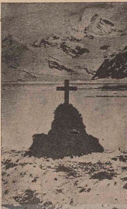
Mormântul lui Ernest Shackleton,

început a face preumblări câte două trei ceasuri la zi, a început să lucreze câte ceva, pentru că atât facultățile mentale, cât și simțirea începuse a-i reveni.