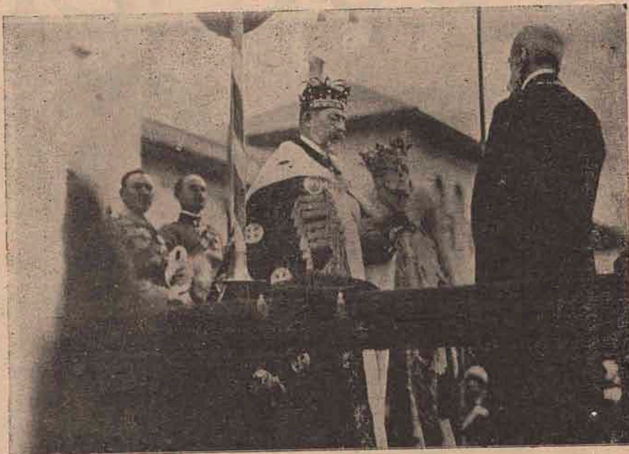
Incoronarea dela Alba-Iulia.

Intregul drum dela gară la cetate, și tot orașul era pavozat încă din ajun cu uriașe steaguri tricolore, superb montate, purtând toate armele României noi. În piața foarte largă nu mai încăpeau automobilele. Cu o zi mai înainte au început să sosească trenurile speciale, aducând lumea, mai ales țărani, din toate părțile. Convoiuri