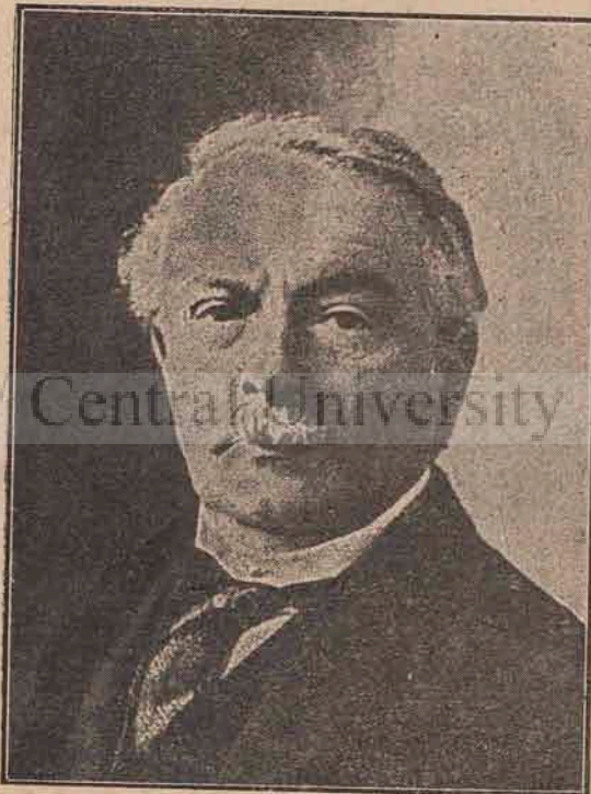
DAVID LLOYD GEORGE

Dar aceasta n'a fost singura lovitură care l-a doborât. Neînțelegerea fundamentală franco-engleză n'a întârziat a-și avea repercusiunile în politica externă. Dacă Polonia n'a primit acu-i un an decât jumătate