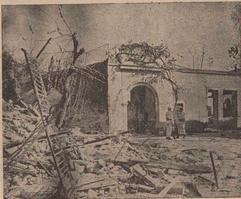
Aspect din ruinele Smyrnei: resturile spitalului francez.