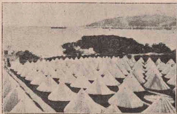
Lagărul de concentrațiune al prizonierilor germani, internați în insula Man, în nordul Angliei.

Ceea ce este curios, e că acest animal vine uneori în număr mare, de mii și zeci de mii și nu se știe nici de unde vin, nici unde dispar.