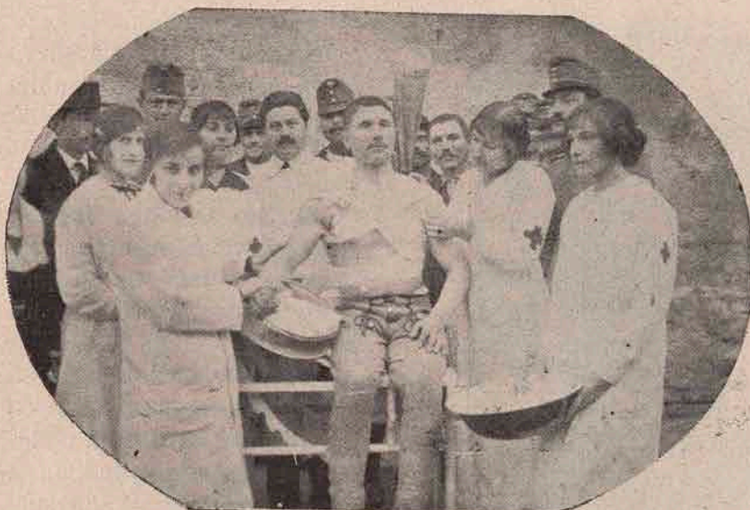
Spitalul „Sf. George“ din Blaj. Domnișoarele din societatea aleasă a Blajului, îngrijesc un soldat rănit.

Strasburg, Metz, Rickendorf (Colonia); iar spre Rusia la Königsberg și Thorn. Al șaselea se găsește la Liegnitz, în apropiere de granița austriacă. Alte 3 hangare militare se găseau la Tegel (Berlin). Apoi se mai găseau 4 hangare transportabile, cu o lățime de 80 metri și erau astfel construite că pot fi montate de 150 oameni în 24 ore.