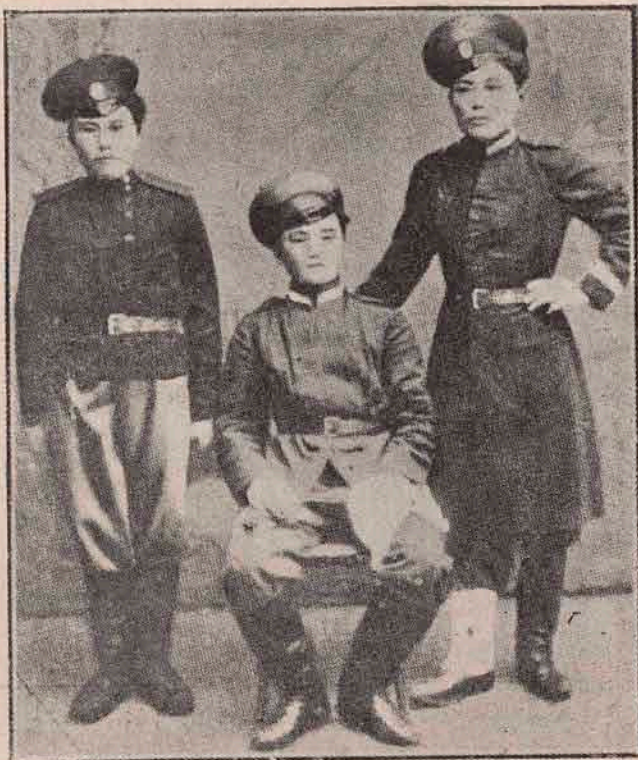
Grup de cazaci calmuci, cei mai fioroși dintre cazacii din Rusia. Ei au ieșit la iveală în deosebi prin năvala lor din Prusia Orientală unde au jefuit și incendiat tot ce se găsea în calea lor. Pagubele pricinuite cu devastățiunile rusești în această regiune germană, se urcă la mai multe milioane.

„Scumpe Domnule Rege“. De ziua sa onomastică, Regele Albert, al Belgiei, a primit dela o fetiță franceză de 8 ani, următoarea scrisoare: