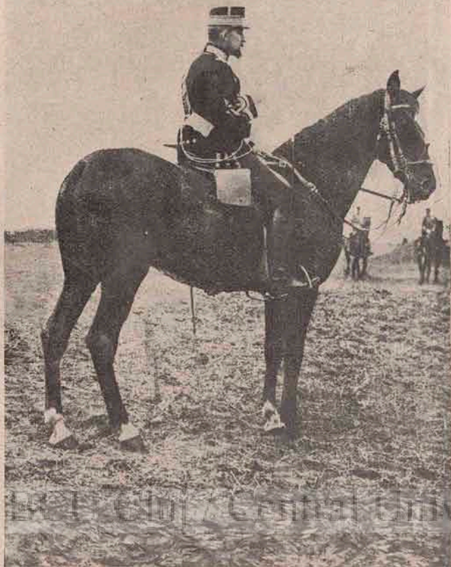
M. Sa Regele Ferdinand I. al României.

aflați în nevoie și primejdie și caută să fie folositor altora. Cercetașul este muncitor și economic; el respectă munca și avutul altuia. Cercetașul este bun cu animalele și se împotrivesc la ori ce acte de cruzime; îi plac plantele și se opune stricăciunilor ce li s'ar aduce. Cercetașul este curat în gând, în vorbă și fapte; el se îngrijește de curățenia trupului, de viața igienică, dând sfaturi și ajutoare. Cercetașul este voios și plin de însufletire în toate împrejurările. Cercetașul se silește să facă în fiecare zi o faptă bună, ori cât de neînsemnată ar fi ea“.