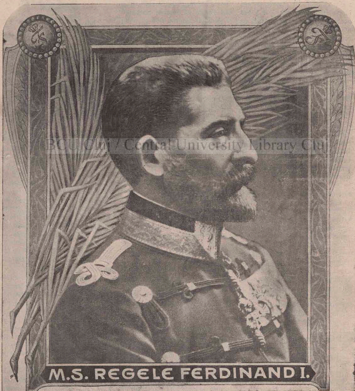
M.S. REGELE FERDINAND I.