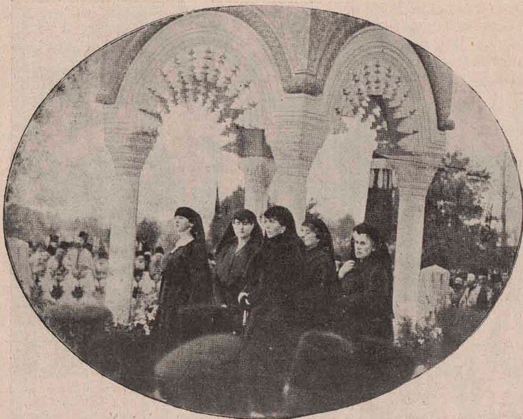
Vedere din minunata Mănăstire dela Argeș, în care a fost așezat spre vecinică odihnă Regele Carol I, al României. Chipul de aci ne arată pe M. S. noua Regină Maria, cu Princesele Elisaveta și Maria (cele 3 dinainte) luând parte la prohodul asupra Regelui Carol în mănăstire.