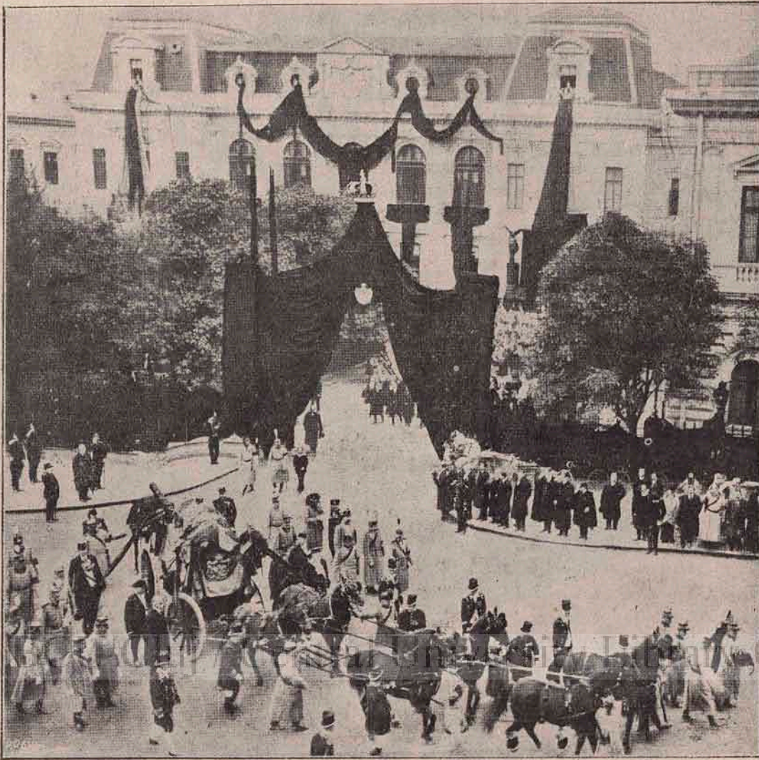
Încă o vedere dela marea înmormântare a Regelui Carol: Palatul Regal din București îndoliat. Perdele negre copăr fațada lui, trase în arcuri dela o fereastră la alta, apoi poarta îmbrăcată în negru, și Coroana regală strălucind peste toate. Chipul ne arată clipa când cortegiul iese din Curtea Palatului.

lângă lucrurile de transport, pe lângă animale, aparate și arme, soldații noștri, sângele nostru, copiii noștri, frații, neamurile și prietini.