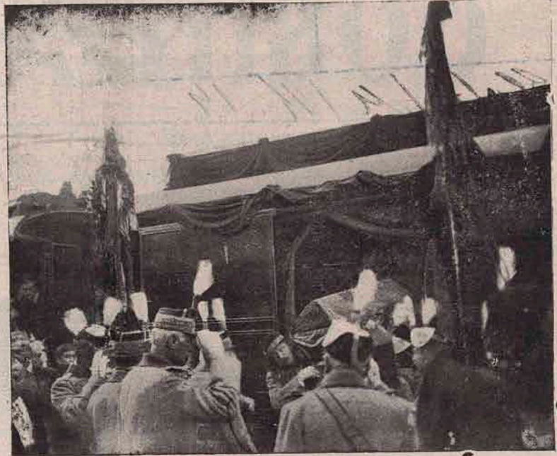
Scoborârea din vagon a sicriului Regelui Carol, când a sosit dela Sinaia la București.

În 9 Sept. n., am fost toată ziua în luptă, și înaintasem deja până la 500 m. aproape de inamic, care să afla în o cetățuie formidabilă, și eră sprijinit de vreo 20 de tunuri.