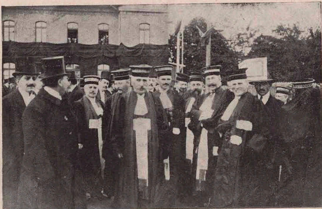
Înălții magistrați, — membrii Curții de Cassație și a Curții de Apel, — la înmormântarea Regelui, purtându-și uniforma lor de judecători.

Comandantul german l-a invitat atunci să urce în automobilul său. Francezul n'a voit să primească, dar înaltul oficer german i-a zis: