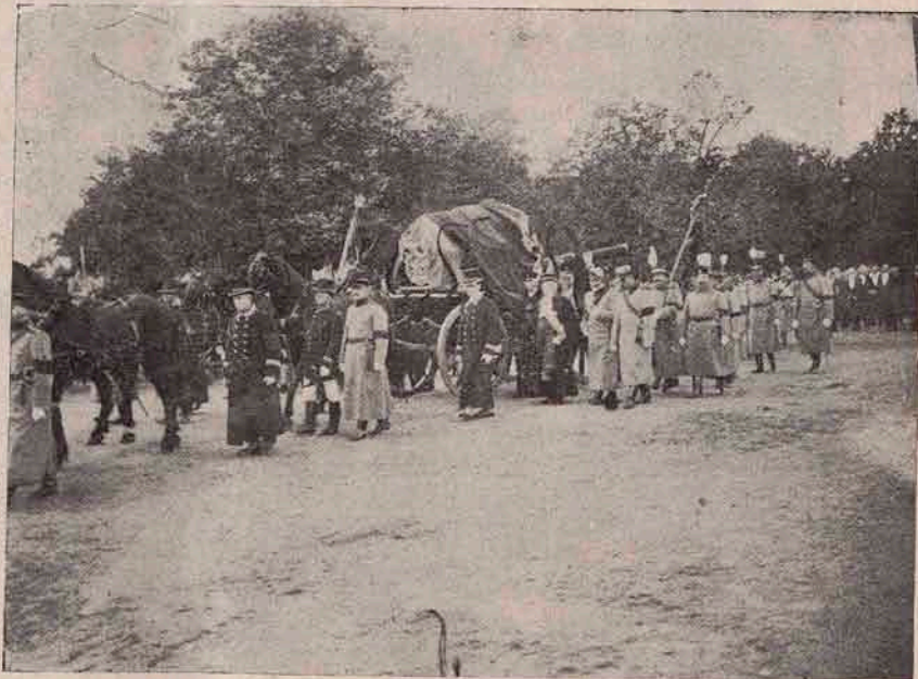
Altă vedere a sicriului Regelui Carol dus pe afetul de tun spre locul odihnei de veci.

„În liniștea serii line, în bubuitul îngrozitor al tunurilor și al mitraliezelor, fără mult zgomot, la un mănunchiu de raze de lună, jumătate ascunsă după un noruleț, îmbrobodită în ceață și ieșind din când în când să mai lumineze un moment corpul rece și neînsuflețit al prietinelui iubit Fabi, — i-am făcut azi, în 24 Oct. n. 1914, prohodul, așezându-l într'un mormânt separat în grădina liceului iezuit din Chyrow.