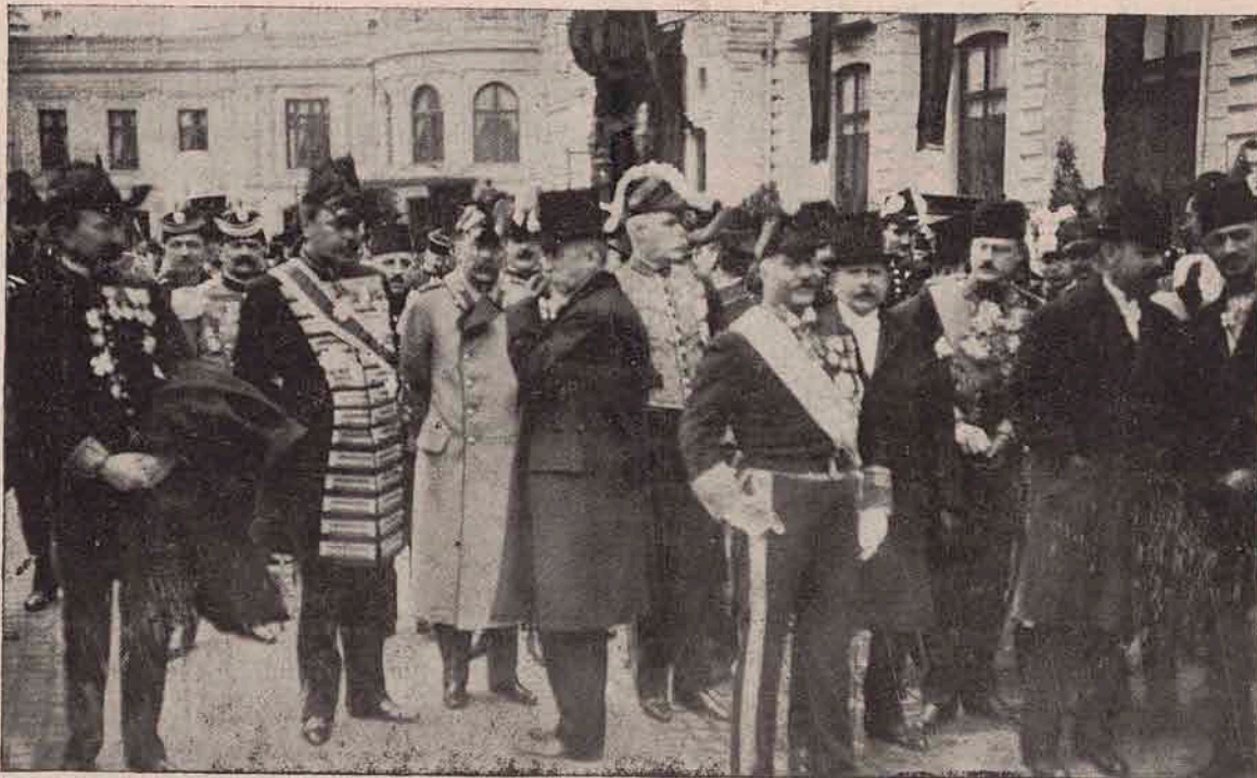
Corpul diplomatic la înmormântarea Regelui Carol: sunt ambasadorii Angliei, Germaniei, Rusiei, Franciei, Italiei, Austroungariei și a celorlalte state, — în uniformele lor pompoase.

germane și orășănești. Nu lipsesc nici reclamele! La sfârșit spune redacția, ziarele obicinuite până la căderea orașului vor ieși iarăși în curând și atunci „Antwerpen Tijden” va încetă de sine!