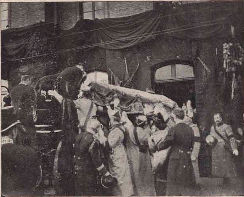
Așezarea sicriului pe afetul de tun, după scoborîrea din vagon.

brăzate cu doliu, par'că ceriul făc'a funerariile celor morți, căci oamenii nu mai aveau timp.