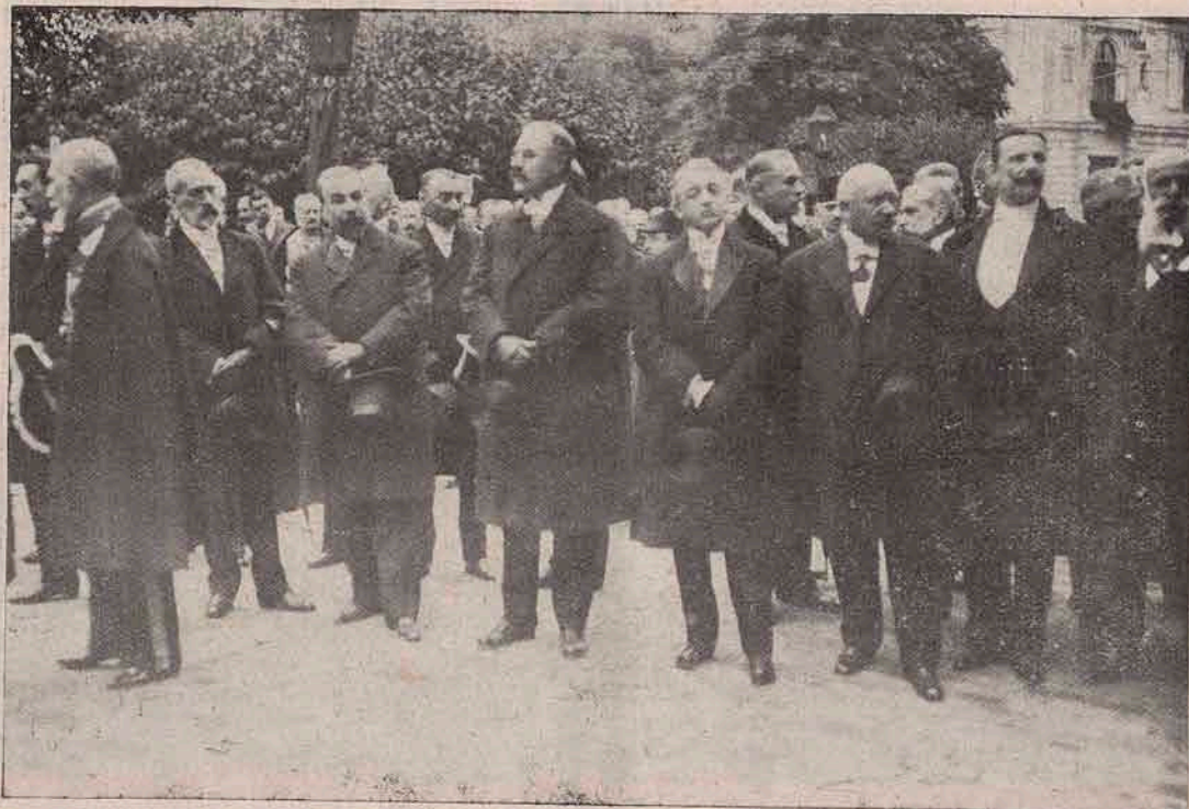
Membrii guvernului, cei 9 ministri ai Țării, la înmormântarea iubitului lor Domn și Stăpân.

El doarme încunjurat de sutele de ostași înmormântați în groapă comună în această grădină, întocmai cum eră încunjurat și când eră în viață, de toți câți îl cunoșteau.