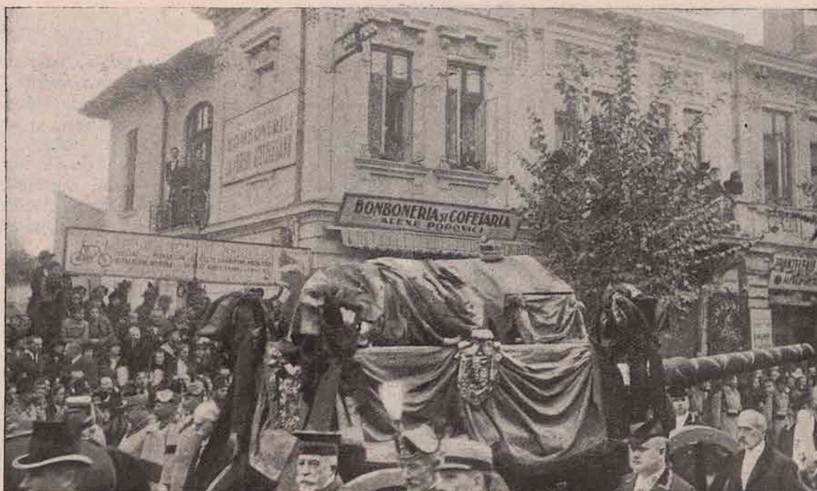
O vedere mai de aproape a afetului de tun cu sicriul Regelui Carol. Se vede tunul învâlit în tricolorul românesc.

reîntoarcere ciocolată, — de cognac voia să îngrijească însuși.