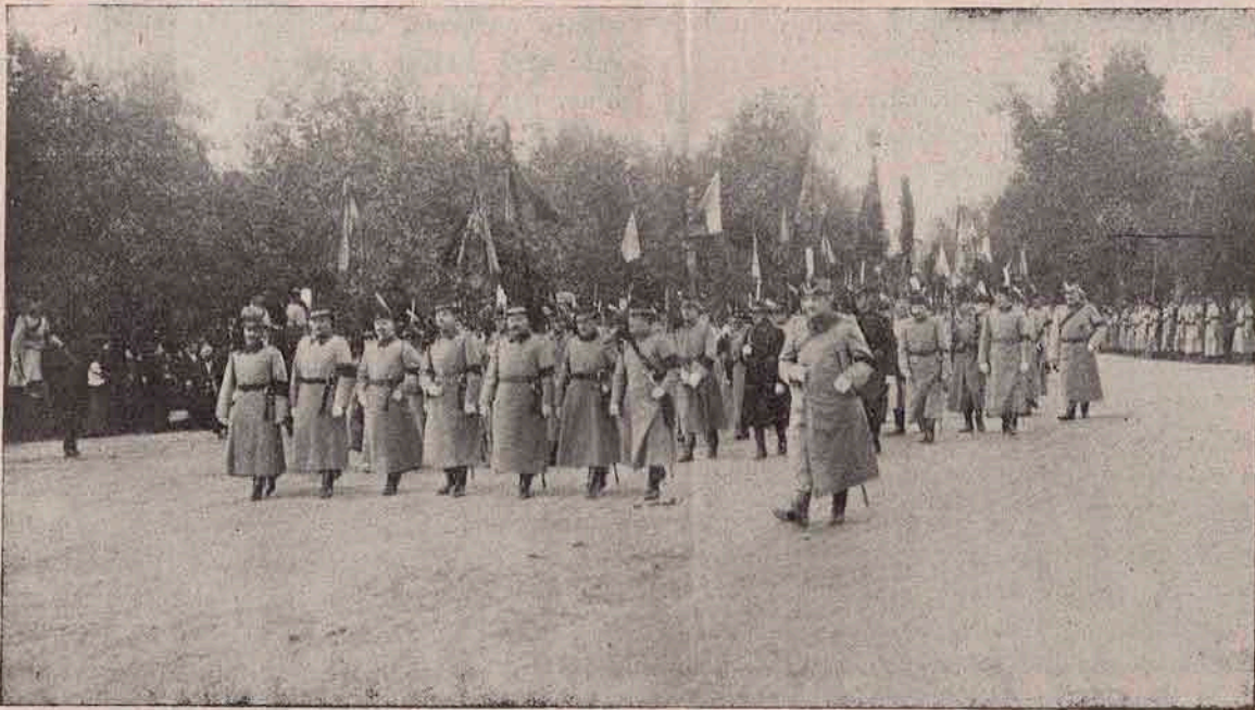
Steagurile cari au trecut prin sfântul botez de foc în războiul neatârării la 1877, purtate de ofițeri, în convoiul de înmormântare, — un impunător codru de steaguri sfinte, zdrănuite!.. (În numărul viitor vom aduce alte 8—9 vederi dela aceeași măreață înmormântare).