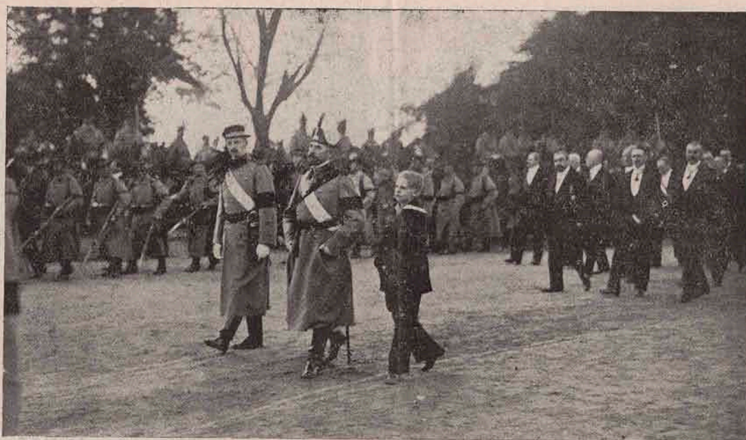
Regele Ferdinand, la dreapta cu Principele de coroană Carol, la stânga cu Prințul Nicolae, pășesc după sicriu în marele convoiu...

la țărnul mării iar Belgianii întăriți acolo cu Englezi și Francezi, le stau în față, — aceea nu s'a mai pomenit nici în acest războiu fără soț. Iaca ce spune știrea din Rotterdam :