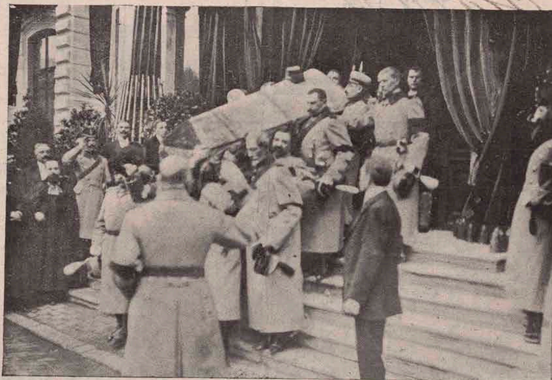
Sicriul cu Regele Carol I e scos din Palat, purtat pe umeri de generali și adjutanți regali; coborât pe treptele mari, în curte, e apoi așezat pe afet...