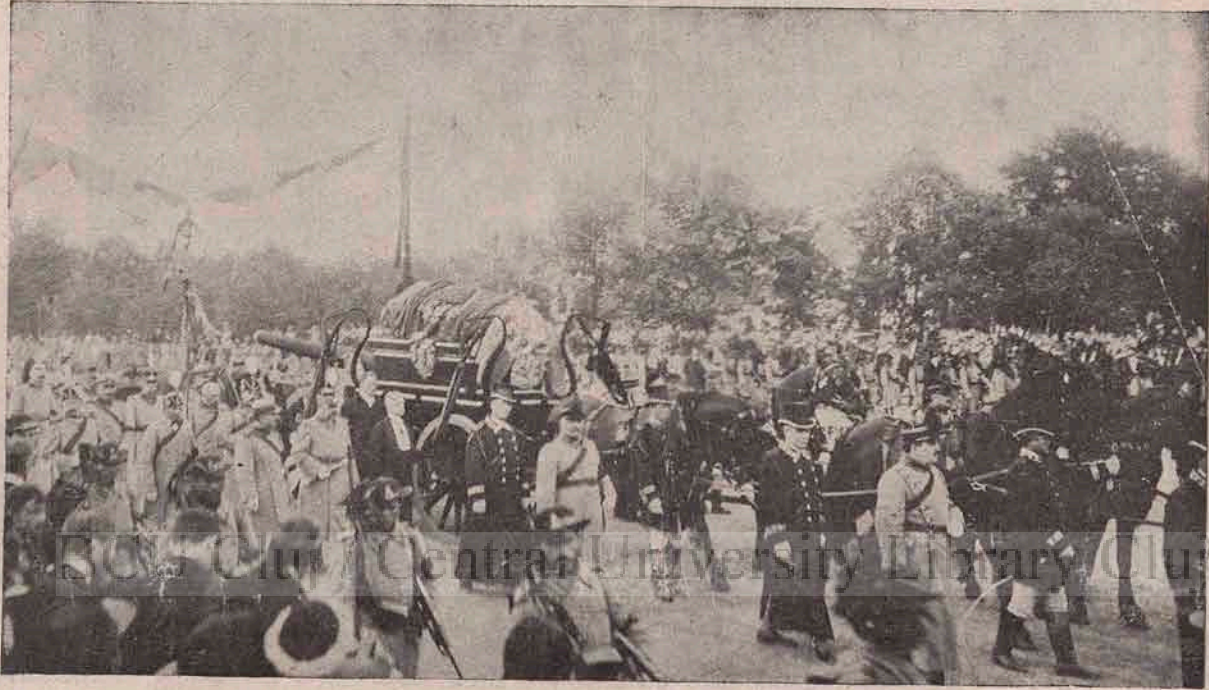
Afetul de tun turcesc dela Plevna, cu sicriul Regelui Carol, trecând pe calea de veci, încungiurat de lumea mare din Țară.