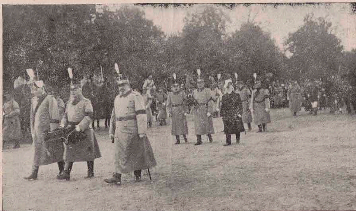
Generalul Hârjeu, ducând sabia de onoare a Regelui Carol , cea bătută în petri scumpe, având la stânga sa un alt general, la dreapta un adjutant regal, — iar după ei Generalul Culcer, purtând pe o periniță Coroana de oțel , la fel însoțit de un general și un adj. reg.