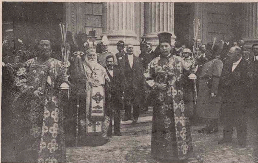
Metropolitul Primat, încungiurat și urmat de înaltul cler, în convoiul ce duce pe Rege spre gară.

E lneru lămurit, spune scriitorul militar Mordacq, că dacă statul major turc, ar fi luat înainte de războiu toate măsurile de lipsă pentru a pune Adrianopolul și Kirk-Kilisse în cea mai bună stare de apărare, ca să nu poată fi cucerite de Bulgari în câteva zile, ci, opăcind aci pe Bulgari, să dea răgaz oștilor turcești de a se aduna și a se rându-bine, — toată armata turcească n'ar fi suferit zdrobirea dela Lüle-Burgas.