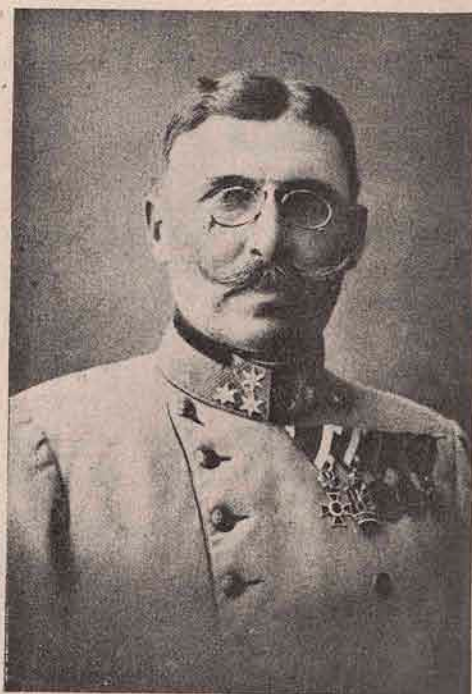
Generalul Auffenberg, inspector al armatei, eroul dela Tamos-Tysovetz, care alătura de Dankl a dus lupte brave pe pământ rusesc. Acum s'a retras cu Dankl cu tot la matca (centrul) armatei, din jos de Lemberg.

Oare dintre cele trei tipuri de ziariști , cari sunt mai de folos pres-