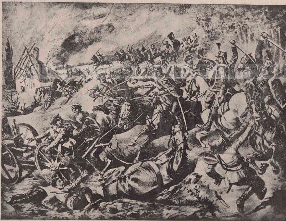
Cumplit' atac de cavalerie la Sattanov, în Rusia. E divizia de husari-honvezi, care, trimisă în o periculoasă recunoaștere, a suferit acolo grele pierderi, dar a și făcut stricăciuni în dușmanii cari o împresurau.