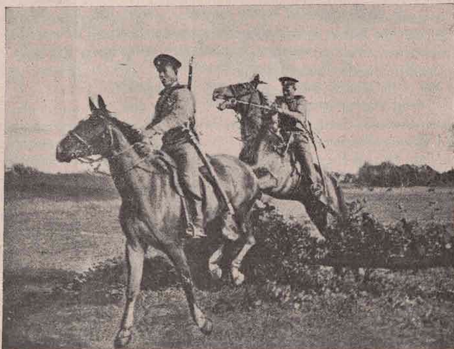
O patrulă de călăreți ruși în avantposturi.

Apoi, ce însemnătate colosală li se va da învingerilor cât de mici, venite din parte dușmană, dacă dușmanii nostri sunt atât de amărâți și prăpădiți. Vedeți, publicul nostru crede că Franțuzu cât ce vede un neamț, se zvârle pe burtă, și că Rușii așa au tulit-o de frica noastră, și până la Irkutzk cu siguranță nu se mai opresc!, — de sârbi nici să nu mai pomenim, — ș’apoi dacă din întâmplare omul dă cu ochii prin vr’un colț de jurnal de o știre strecurată care spune că vreo patrulă de a noastră s’a ciocnit cu inamicul, dar acela încă a tras câteva focuri de carabină, ori că: din tactică ne-am retras, etc., din încrederea cea mai mare îi vezi pe oameni numai cum se în-