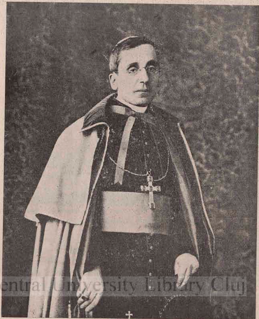
Noul Papă, care își ocupă tronul sub numele de Benedict XV.

Poate mai des se află obiecte cioplite din nefrit. Despre originea acestor obiecte, părerile sunt dife-