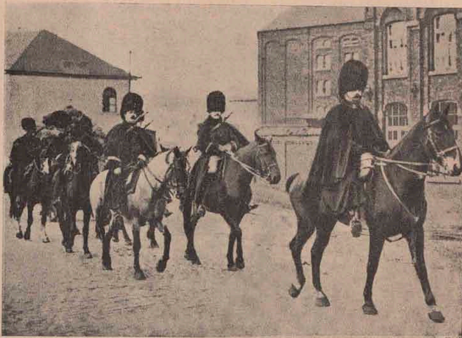
Cavalerie belgiană de graniță, care ea a avut parte de cel dintâi foc în acest războiu germano-francez, întimpinând ea ca dintâi oștile germane ce le intrau în țară.

Pe miriște clăi de-avalma Iar la umbra unei clăi, Tolăniți pe-un pâlț de iarbă, Stau de taină doi flăcăi.