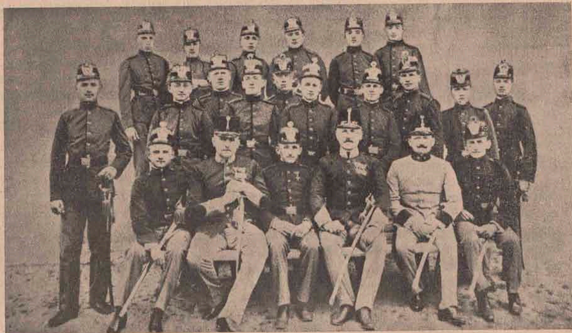
Tinerii cadeți, chemați la proba tăriei lor sufletești: Sunt tineri absolvenți ai școalei de cadeți din Timișoara, cari la 1 August au fost înaintați locțiitori de ofițeri și — trimiși la trupe și cu trupele, pe câmpul de războiu. Sunt tot băieți tineri de 19—20 ani. Nainte de a se risipi printre trupe, s'au fotografiat cu ofițerii lor instructori între ei.

E prea scump divorțul. Din Newyork se vestește: luriștii americani au avut un mare sfat în care s'au desbătut unele legi americane, cari vor fi schimbate încurând. Mai multă bătae de cap le-a dat învățăților legea de căsătorii și legea de divorț. După lungi discuții în privința aceasta, a răzbit părerea acelorora, cari au propus că: în Statele Unite din întreagă America-de-Nord să fie una și aceeași lege de căsătorii, pentru că numai așa s'ar putea înlătură multele proese de divorț, cari toate dovedesc, că în America se leagă căsătoriile prea ușuratic. S'a arătat ce păgubitoare sunt pentru viața socială divorțurile și s'a dovedit, că nicăiri nu mai sunt atâtea femei despărțite și copii pribegi părăsiți de părinți, ca în Statele Unite ale Americii-de-Nord. Tot mai mult s'a întărit convingerea Americanilor, că nu divorțul trebuie făcut anevoios, ori chiar imposibil, prin lege, — ci legea căsătoriei trebuie puțin îngreunată.