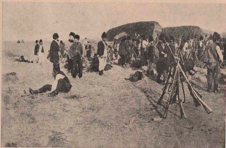
Vedere din armata sârbească: Sârbia și-a chemat sub arme și gloatele clasa a 2-a. Chipul de aci ne arată o trupă de astfel de gloate. Sunt oamenii în hainele lor de-acasă, doar de-au căpătat pușcă și gloanțe.