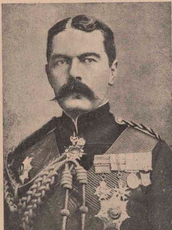
Armata engleză: Lordul Kitchener, fostul vicerege al Indiilor, — numit acum, din prilegiul războiului ministru de războiu al Angliei. El e care a dus la încheiere războiul contra Burilor, care până a nu primi el comanda supremă pe acel câmp de luptă, mergea prost pentru Englezi.