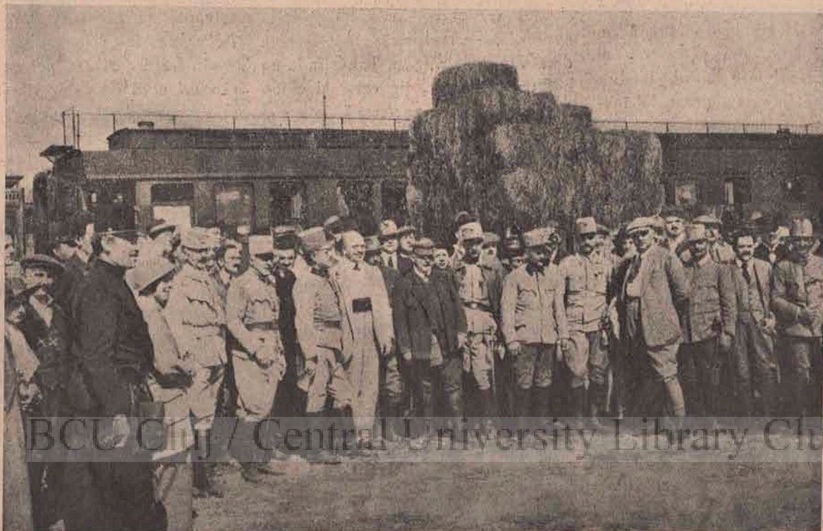
Ziariștii pe câmpul de războiu. — Vezi la „Rânduri mărunte“ —