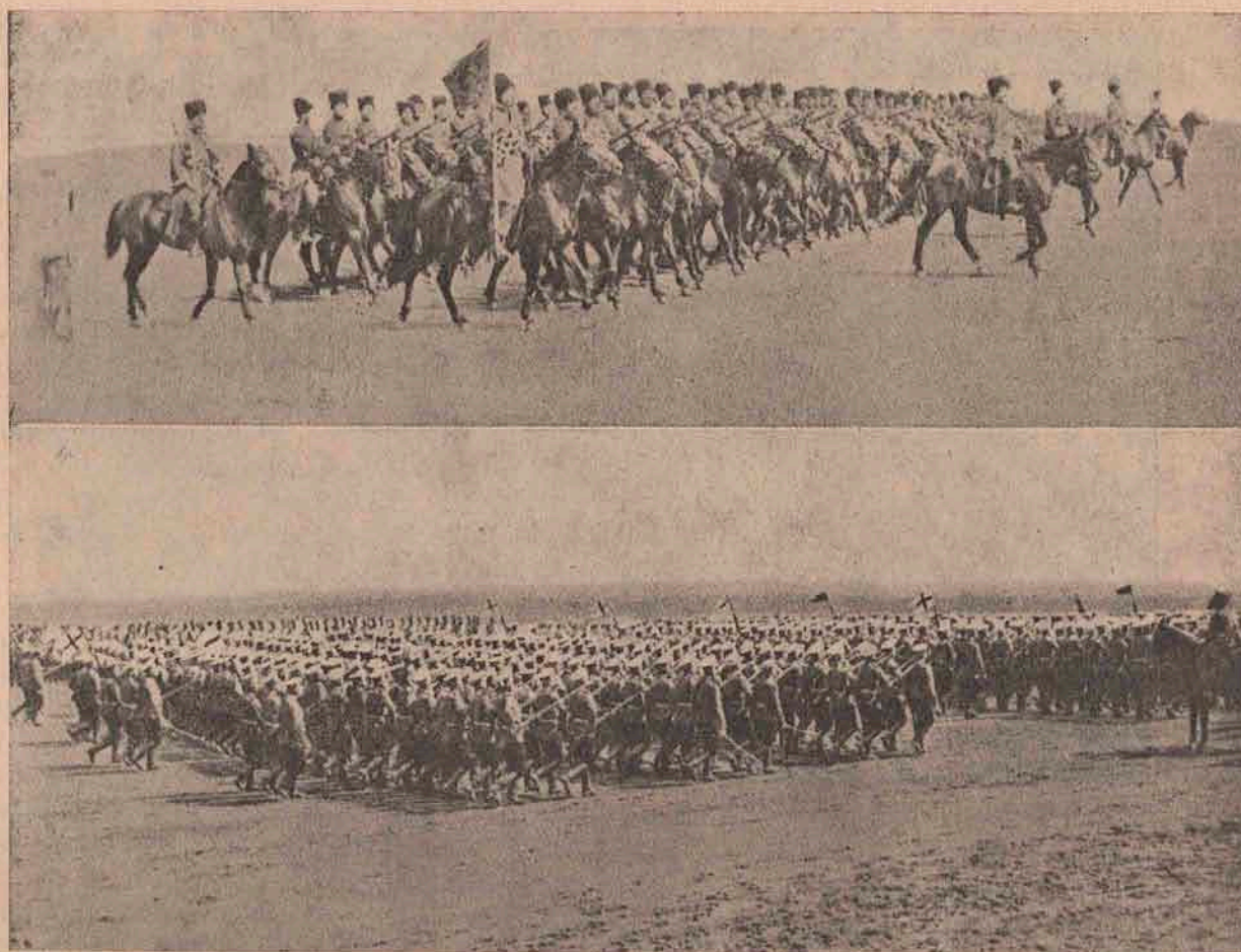
Vederi din armata rusească. Sus: defilarea unei sotnii, companii, de cazaci, jos: defilarea unui batalion de infanterie rus.

ratul face o nouă plimbare în parc de astădată însoțit și de țarevici, în compania căruia se simte foarte fericit.