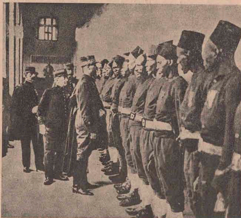
Armata franceză: Pregătirea trupelor africane, pentru a fi aduse se iee și ele parte la războiul „țării-mame“, în Europa. Ofițeri francezi le trec în revistă și le arată scopul înarmării. Ziarele spun, că deja astfel de trupe au fost debarcate în Franția și vor fi trimise pe câmpul de luptă.

N. O. Atât „Eroul“, cât și „Serenada“ sunt încercări slăbuțe, cari nu fac pentru noi.