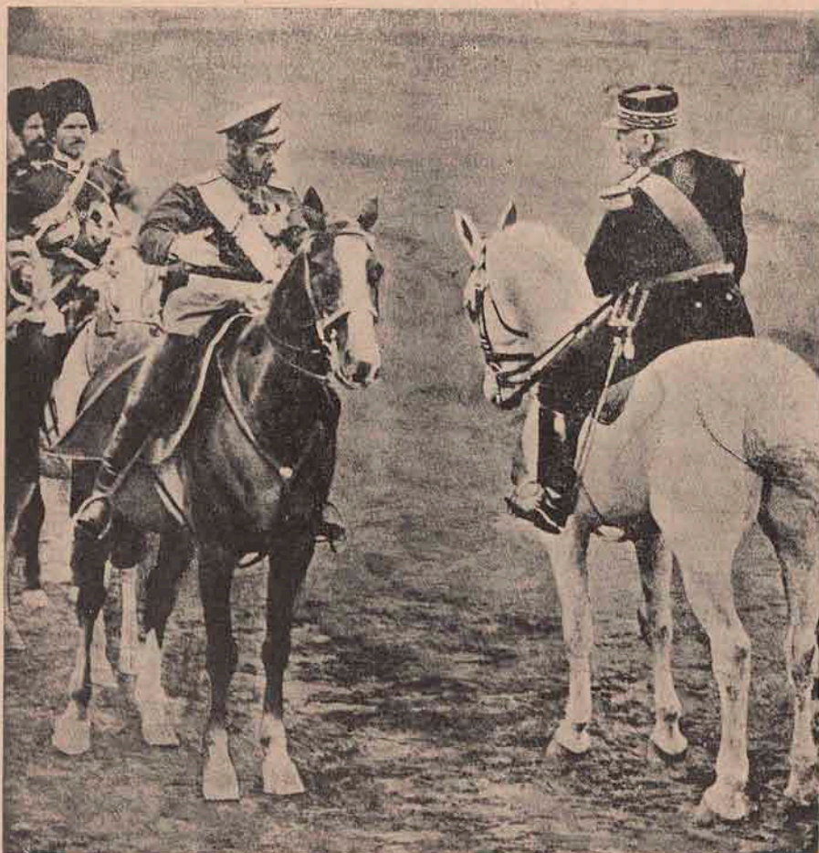
Comandanți supremi ai celor două armate aliate, rusă și franceză: Țarul Nicolae la stânga și generalul francez Joffre , generalissimul armatei franceze de operațiuni.