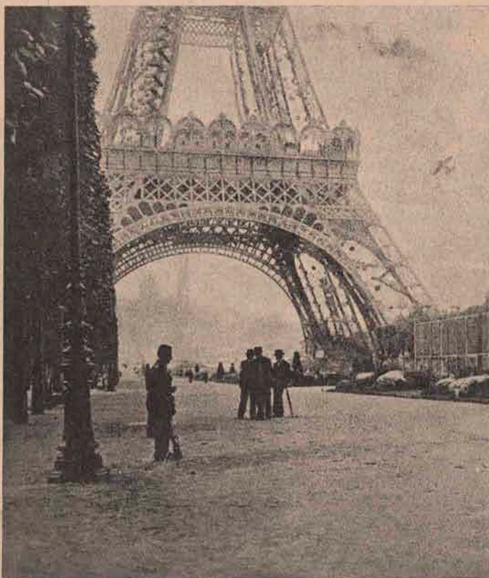
Turnul Eiffel din Paris, pus în slujba războiului: În acest turn uriaș e instalată azi o stațiune de radiotelegrafie, pentru trimiterea de avize din capitală pe câmpul de războiu și primirea de știri și cereri de pe acel câmp, provăzută cu stațiuni telegrafice fără sârmă.

Interesant a vorbit despre căsătorie și divorț: Dr. Ana Howard Show, prezidenta ligei femeilor americane.