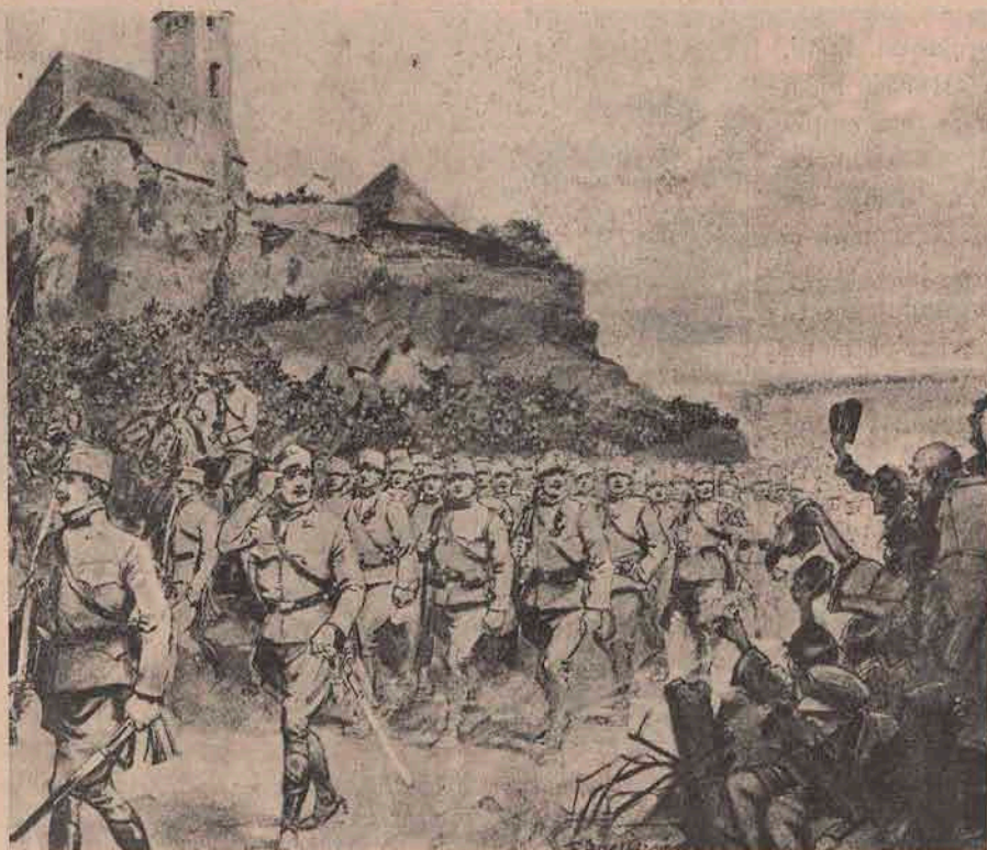
Vedere de pe câmpul de luptă din Polonia rusească: După ce trupele rusești s'au retras, trupele noastre austro-ungare intră în orașul Walbron, fiind primite de populația polonă cu aclamații, — căci Polonii, își nădăjduesc liberarea după ce trupele noastre vor rămâne definitiv învingătoare asupra celor rusești.