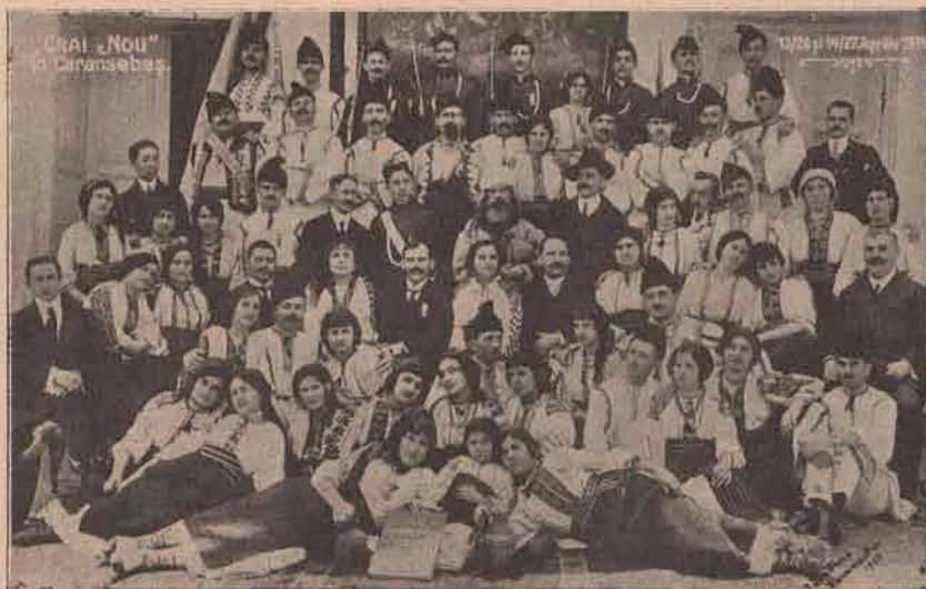
„Crai nou“ în Caransebeș.

compusă din diamante și smaragde, care reprezintă un trifoi în patru foi și eră primul cadou al soțului ei.