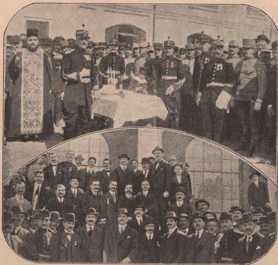
¶ Vedere din Balçic: O sărbare militară sub zidurile cetății: slujba dzeiască premerge parazi. În chipul de jos al publicului, Români și Bulgari, azistând la paradă.