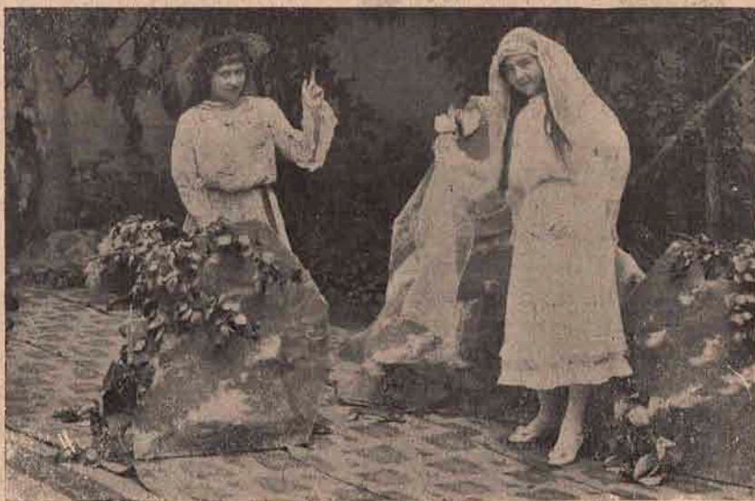
Tot scenă din „Crăiasa Codrului”, cu care drăguțele diletante au avut foarte frumos succes.

Centrul studentesc a făcut apel la toți artiștii din țară și din străinătate.