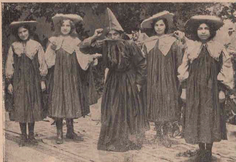
Altă scenă din „Crăiasa Codrului” jucată la Beiuș.

Iată un titlu care ar face pe ori-cine să zimbească; iată un titlu care ar putea să fie luat de ori-cine