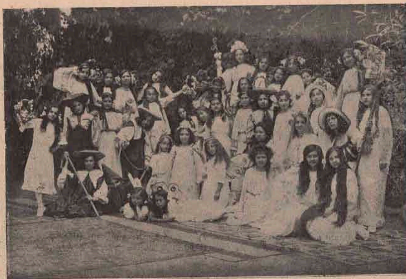
Scene din „Crăiasa Codrului”, piesă jucată de fetițe Internațului „Pavelian” din Beiuș.