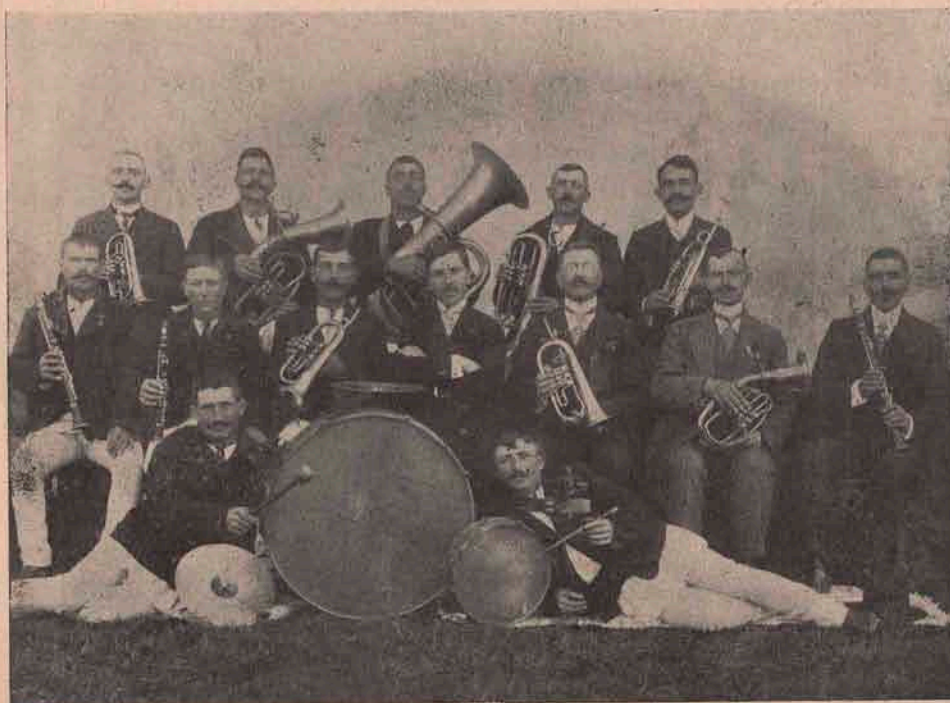
Fanfara „Reuniunii române de cântări” din Mercurea.