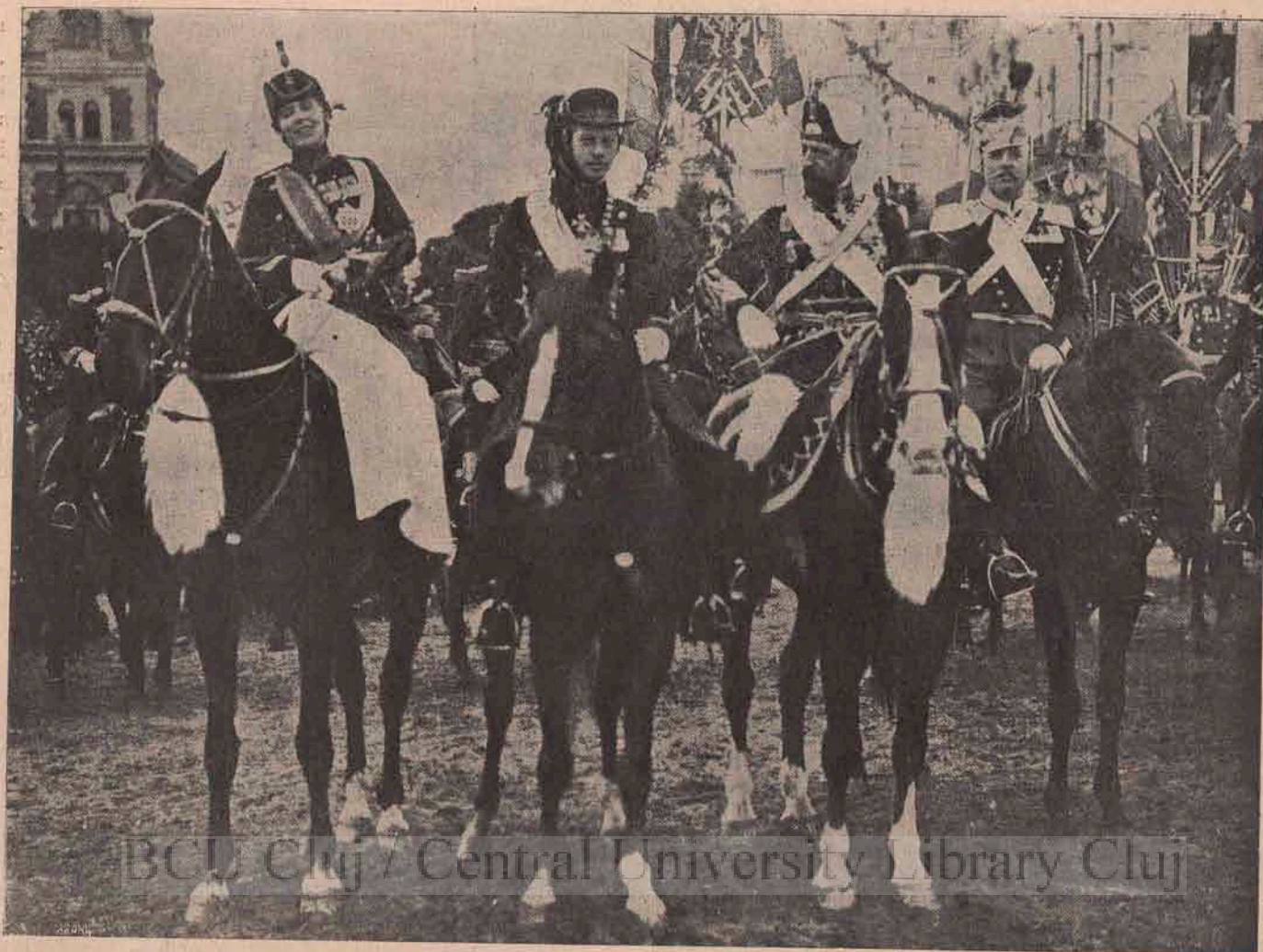
Vedere dela serbarea de 10 Maiu în București: O scenă din marea defilare a armatei pe dinaintea Regelui Carol: La stânga e Princesesa Maria , în uniformă de Colonel de Roșiori, călărind în fruntea Regimentului său; la dreapta Prințul Carol în uniformă sa de locotenent de Vânători, mai la dreapta Principele Ferdinand ca general de Roșiori, iar la dreapta de tot Prințul German Waldek Pirmont , ce se află în București.

mânile mai libere. Directorul și conducerea școlii, au toată încrederea, de care nu abuzează niciodată. E ușor să ne închipuim aceasta, gândindu-ne cât de mult se ține la cinste în Apus.