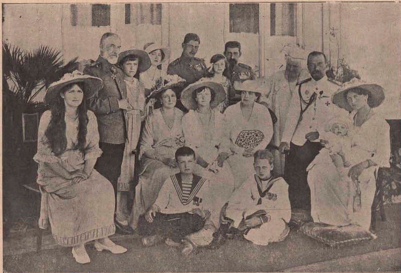
Intrevederea dela Constanța: Familia imperială rusească, fotografiată la un loc cu cea regală română, al cărei oaspe era. Iaca cine sunt (ceții dela stânga la dreapta): Șirul ce merge sus: La stânga e una din fiicele Țarului, Marea Ducesă Anastasia, lângă ea, în șirul de sus, M. S. Regele Carol; altă fiică a Țarului: Marea Ducesă Maria, lângă ea Princesesa română Mărioara, urmează Principele Carol, apoi Princesesa Ileana, Principele Ferdinand, Regina Elisabeta, M. S. Țarul, apoi Marea Ducesă Olga, care ține în brațe pe micul Principe român Mircea. — La mijloc în chip se văd: Țarevna Rusiei, Marea Ducesă Tatiana și Princesesa Maria. — Jos: Țareviciul Alexiș cu Prințșorul Nicolae, care s'au jucat mult și s'au luptat și și-au stricat jucăriile...