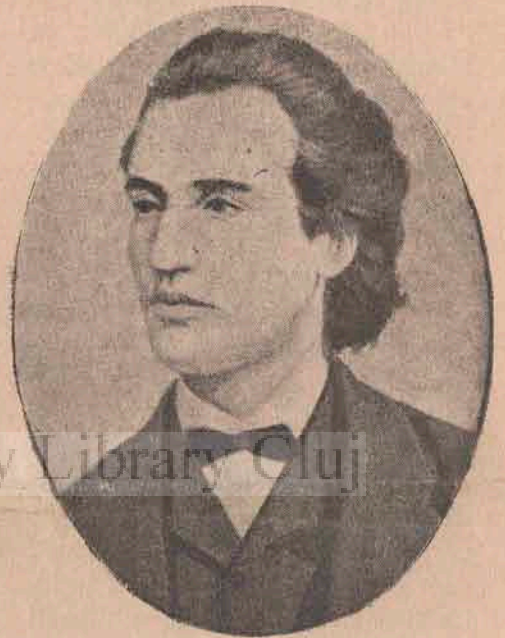
Eminescu la 20 de ani.