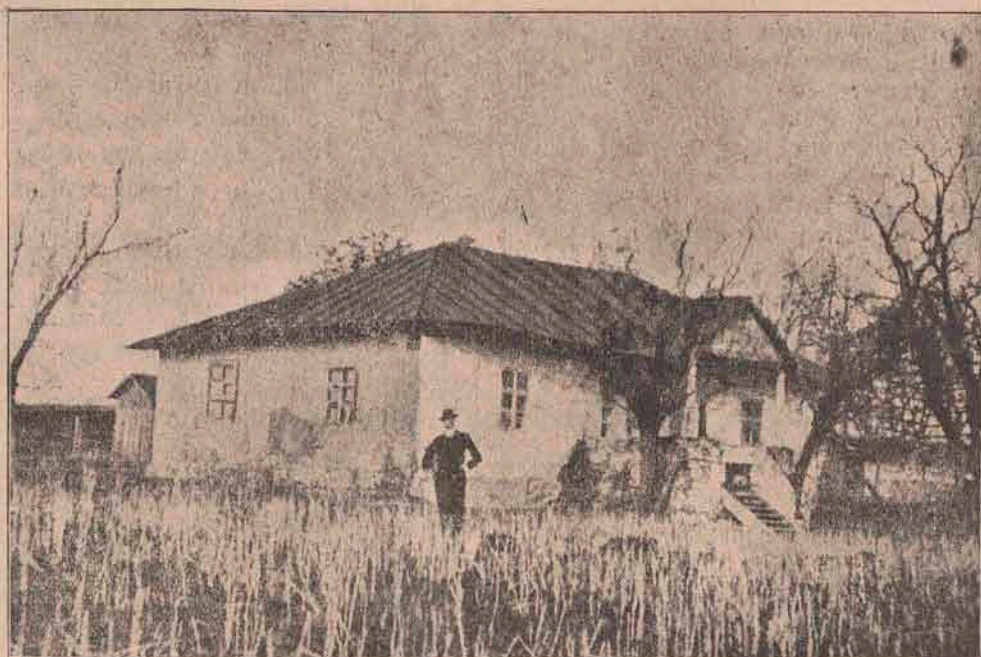
Casa din Ipotești, unde s'a născut Mihail Eminescu, la 15 Ianuarie, 1850.