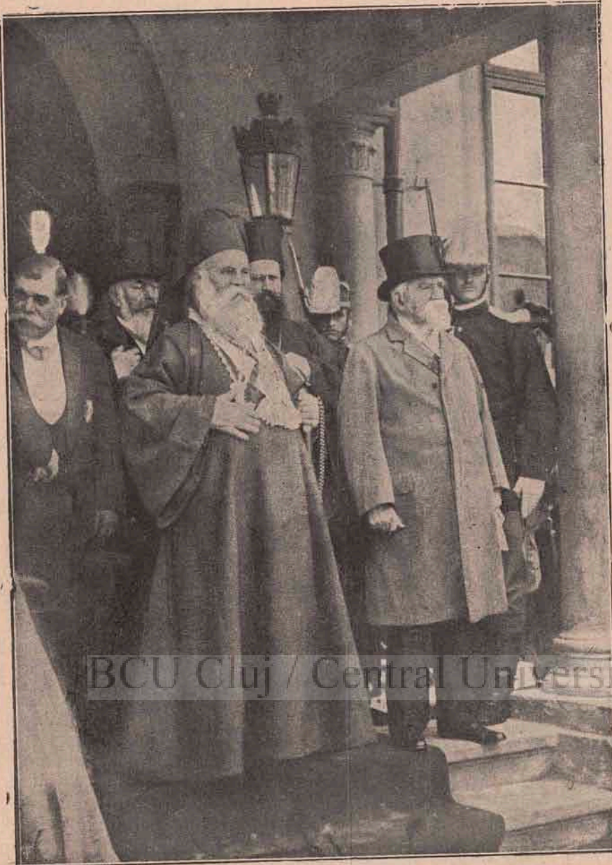
Ministrul președinte T. Maiorescu și metropolitul-primat al României privesc plecarea soldaților români în Bulgaria.