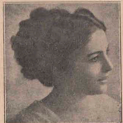
Tip de frumseță din Peru.

Cei dintâi luminători ai omului au fost, firește, pe lângă soare: crai al zilei, luna, stelele și licăririle scurte ale fulgerului. Cu vremea, când geniul lui ocrotitor, poreclit de legendă Prometheu, l-a învățat să stoarcă flacări din sinul naturei: aveă lumina pălpăitoare a focului de găteje. Păreții umezi și reci ai celor dintâi locuințe omenești, peșterile scunde, în lumina acestui foc ș'au desfășurat ungherele. Abia târziu pe vremea Faraonilor Egiptului se ivesc celea dintâi lampe. Istoria face pomenire de acest fel de unelte, dar nu se poate ști mai apropiat cum au putut să fie ele. Eroii „Iliadei“ și ai „Odisseei“ au întrebuișat facile, cari nu erau altceva decât așchii sau crengi înmuiate în oleu, ori în rășină de brad. Oleul de olive, în vechime eră un articol peste măsură de pre-