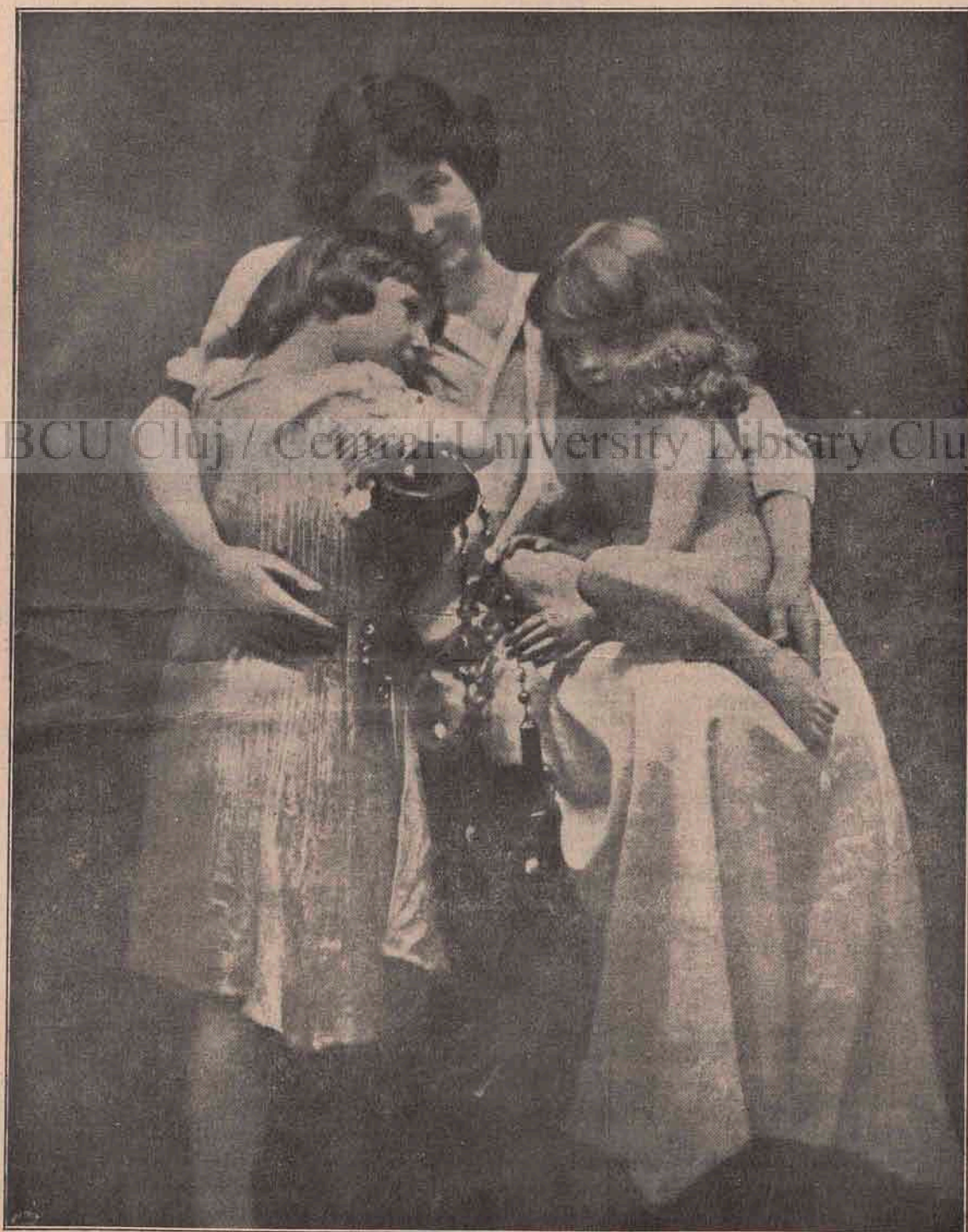
Celebra actriță franceză, Isadora Duncan, cu copilașii săi, cari s'au înecat în Sena.