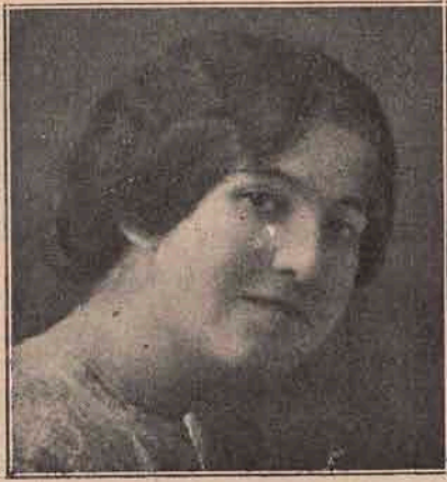
Tip de frumseță din Brazilia.