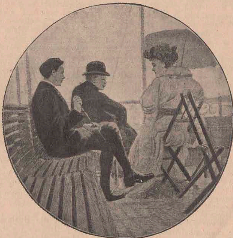
Ea: Aș vrea să știu la ce te gândești, când privești marea. El: La tine. Știi, găsesc, că e tot așa de... lesne schimbăcioasă.

„Invenția senzațională a inginerului Ulivi — scria o gazetă de boulevard — face imposibilă orice acțiune de războiu pentru viitor. In-