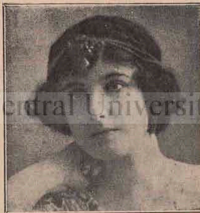
Tip de frumseță din Uruguay.

Femeile din toate statele americane de sud sunt într'adevăr frumoase și afară de aceasta și foarte bogate. La bogăție au ajuns așa, că în Argentina și în alte părți, nainte cu 25—30 de ani pământurile fiind foarte estine, oamenii au cumpărat