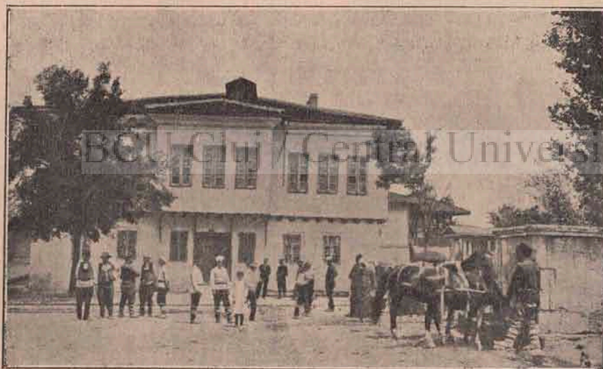
Judecătoria de pace.