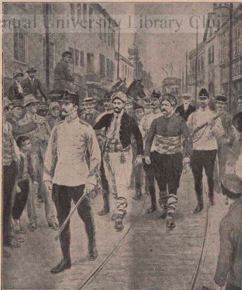
Aducerea prizonierilor bulgari în București.