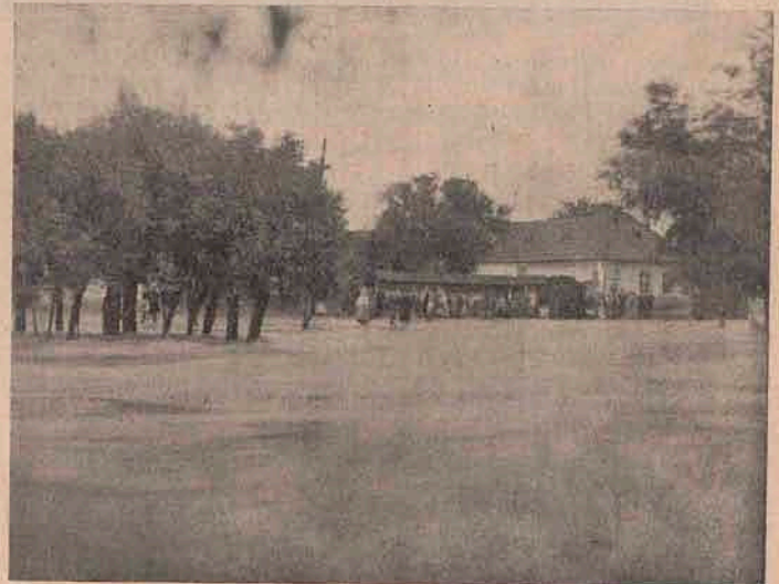
Strada Fabricii din Orăștie sub apă.

Potopul din zilele trecute a făcut ravagii cumplite îndeosebi pe valea Murășului și chiar în Orăștie râurile de munte au ieșit din alvie și au acoperit câteva străzi mărginașe ale orașului.