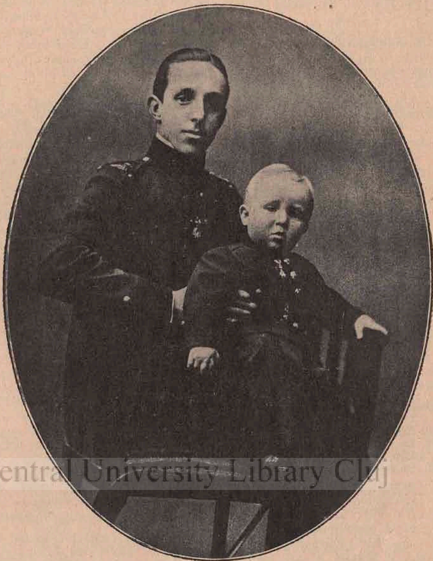
Regele Spaniei, Alfonso XIII împreună cu micuțul moștenitor de tron.

În revendicările maselor, nimic nu a fost și nu e mai fecund ca pildele de auto-sacrificiu. Fanaticii tuturor cauzelor, au fost cei mai utili întru realizarea lor. Rațiunea clară și prudentă nu va putea nici odată lupta cu actele excesive ale iluminatiilor. Ele sunt rodnice și con-