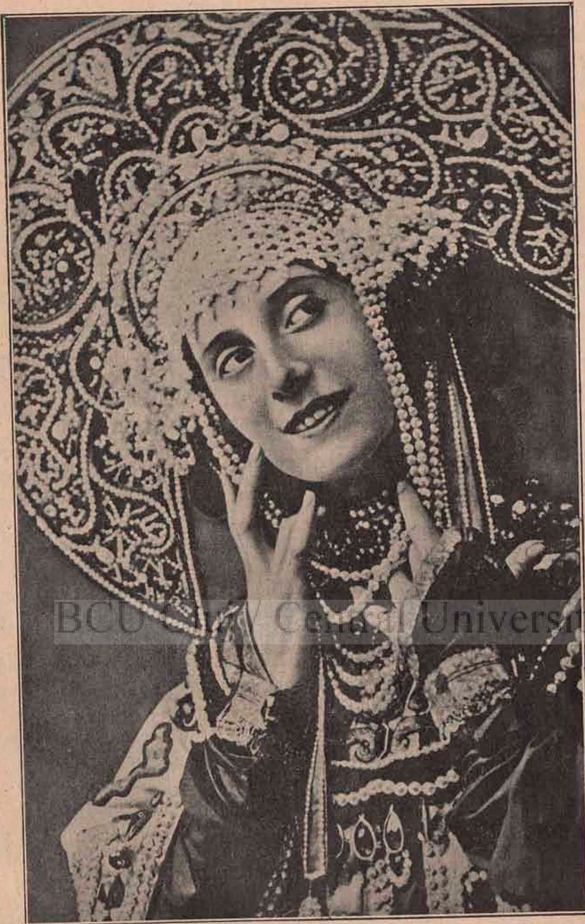
Celebra dansatoare rusă Pavlova, împodobită cu diamantele ce le poartă, când pășește pe scenă. E una dintre cele mai renumite dansatoare din lume și ca joc și ca frumusețe și ca bogăție. De prezent are succese mari în Paris.

Potopul s'a deslănțuit și de data asta mai ales peste părțile noastre românești. Bănatul a fost înecat iarăș. Timișul, Begheiu, Bârzava, s'au năpusit peste câmpii cu furia veche. Tot asemenea Crișurile, Streiu, Arieșul. Iar Murășul nostru a înecat de nou câmpiile dela Alba-Iulia la vale. Câmpul pâinii e tot un lac. Pe la Deva potopul a făcut pagube grozave.