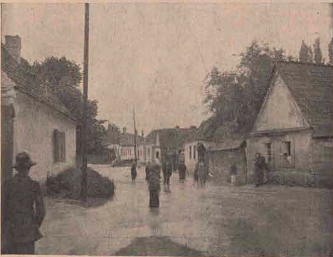
Strada Porumbului din Orăștie sub apă.