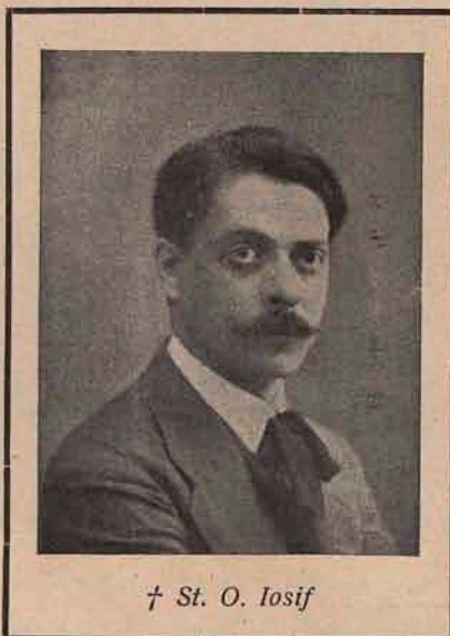
† St. O. Iosif

A muncit totdeauna serios și a căutat să-și îmbogățească mereu sufletul cu imagini frumoase din geniile neamurilor streine. Număroase traduceri din autorii streini date de el la