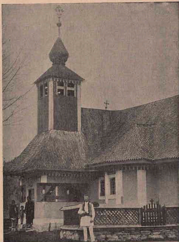
Biserica gr.-cat. română din Corbu.

Vedem minunate cămeși „cu lăcrit“, cari ar putea să împodobească trupuri de împărătese în clipele lor