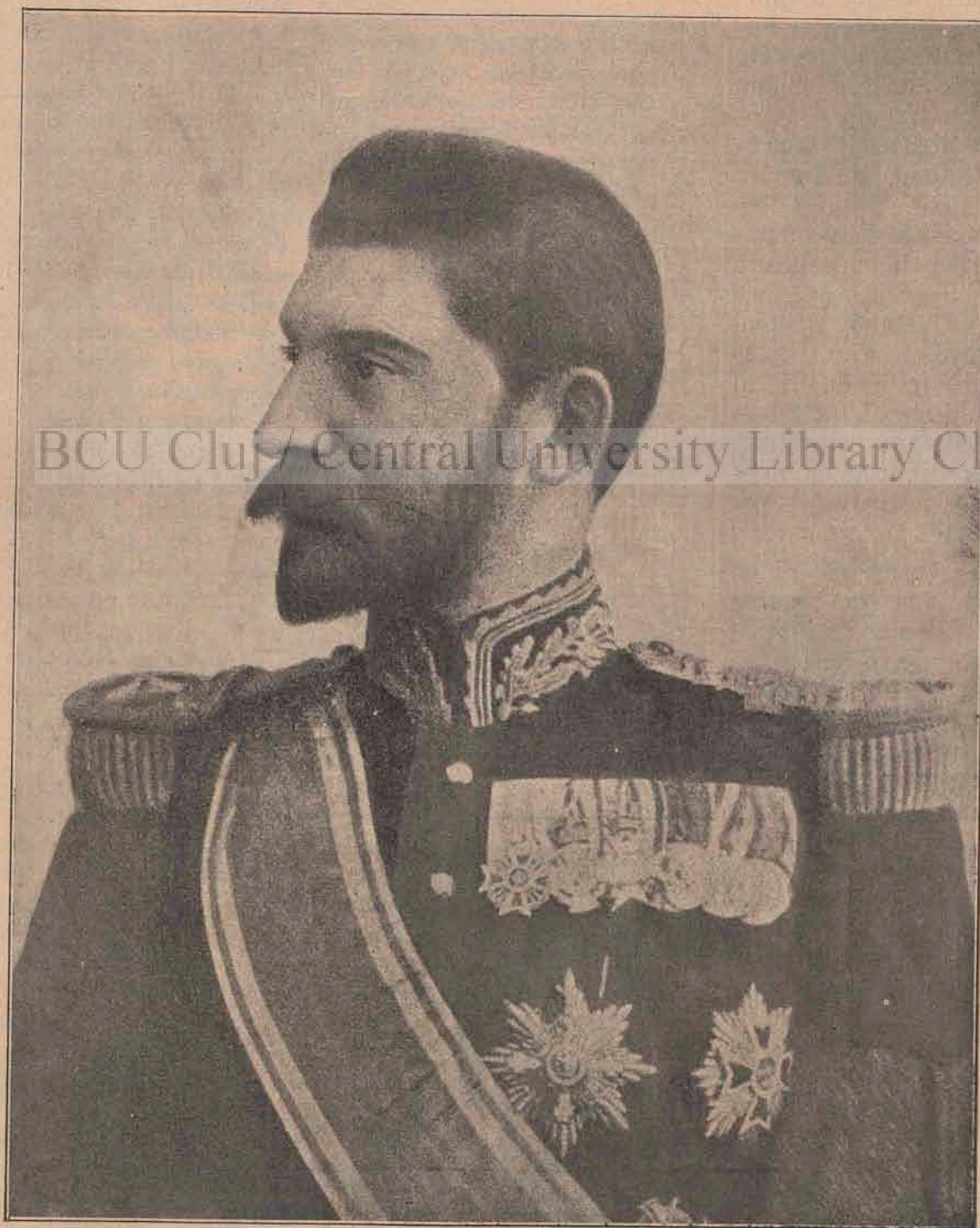
Principele Ferdinand, conducătorul armatei române, ce trece Dunărea.