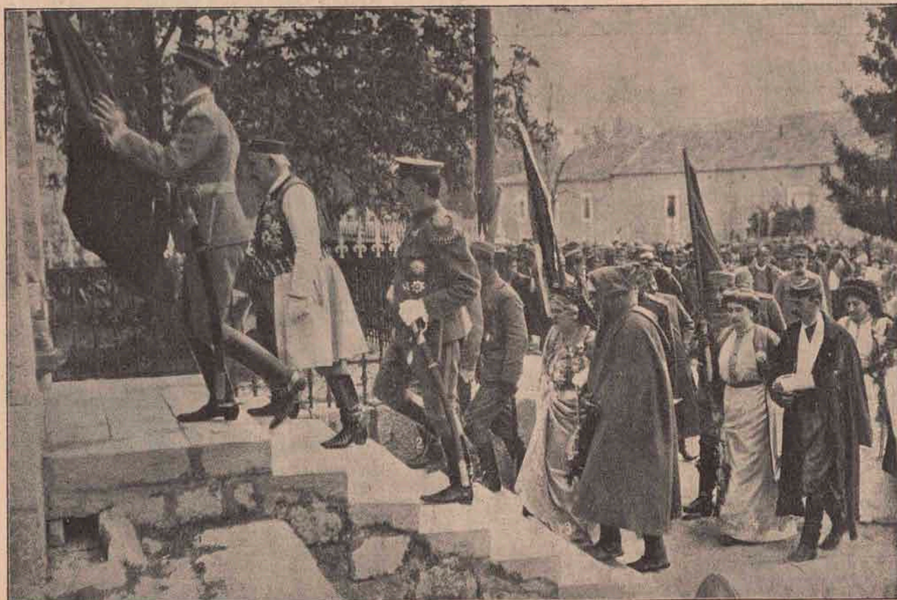
Regele Nichita și familia sa mergând să înalțe rugăciuni în biserică după ocuparea orașului Scutari, pe care Muntenegrenii au fost apoi nevoiți ca să-l cedeze din nou Albaniei.

Într'adevăr, se petrecea o minune. Arătarea se imaterializă tot mai mult. Se destrămă, ca o fantomă