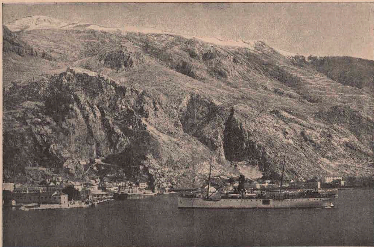
Vederea generală a orașului Cattaro, pe coastele Dalmației, dela care duc singurul drum ușor de umblat înspre Cetinje, capitala Muntenegrului.