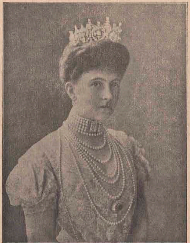
Sofia, noua regină a Greciei, născută principesă de Prusia, sora împăratului Wilhelm II. al Germaniei.