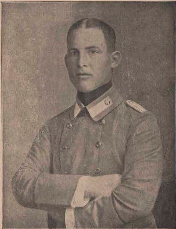
George, principele de coroană al Greciei, cel mai în vârstă băiat al noului rege Constantin al XII-lea.

Doctorul: De legat, amicul meu. (Judecătorului). Ne vom ocupa acum de fenomenele atavice, domnule judecător de instrucție. Sunt de cea mai mare importanță. În totdeauna nebunii numără alți nebuni în familie. Dumneavoastră, magistrații, îi întrebați pe vinovați: „Ce făceați voi în noaptea cutare?“ Noi, savanții,