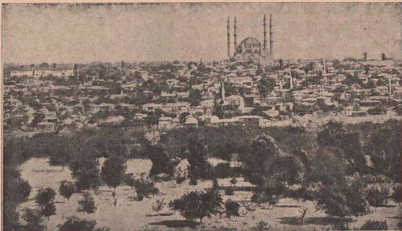
Vederea generală a Adrianopolului, pe care trupele aliate bulgare și sârbești l-au cucerit în 25 Martie. După cele mai noi știri, cel dintâi regiment, care a intrat în cetate, a fost un regiment sârbesc stătător numai din feciori români de pe valea Timocului.