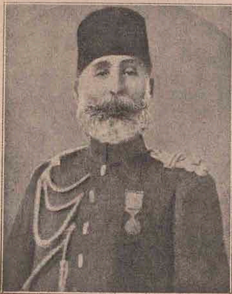
Eroul dela Adrianopol: pașa Sucri.

Precum tonurile muzicale și peste tot sunetele nu sunt alceva după natura lor, decât vibrațiuni de corpuri elastice, întocmai așa și lumina constă din vibrațiuni de ale eterului , substanța ipotetică, ce umple întreg spațiul atât cel infinit de mic, cât și cel infinit de mare. Însă eterul e un corp mult mai perfect, mult mai fin, decât corpurile cari acționează asupra simțurilor noastre. Urmarea e, că vibrațiunile, deci și mișcarea undulatoare ce se naște din vibrațiuni, e mai regulată și se face neasemănat mai repede în eter, decât în corpurile sunătoare. Lungimea undelor de eter, dintr'o rază de lumină ce ajunge la noi, variază între a 400 și 800 milioane parte dintr'un milimetru. Între limitele acestea se cuprinde lungimea de undă din orice rază de lumină. Mii și mii de tomuri de lumină trebuie să se unească într'olaltă spre a forma acel acord , care străbate și ajunge la noi ca rază de lumină albă . Când o conducem printr'o prismă, ea se