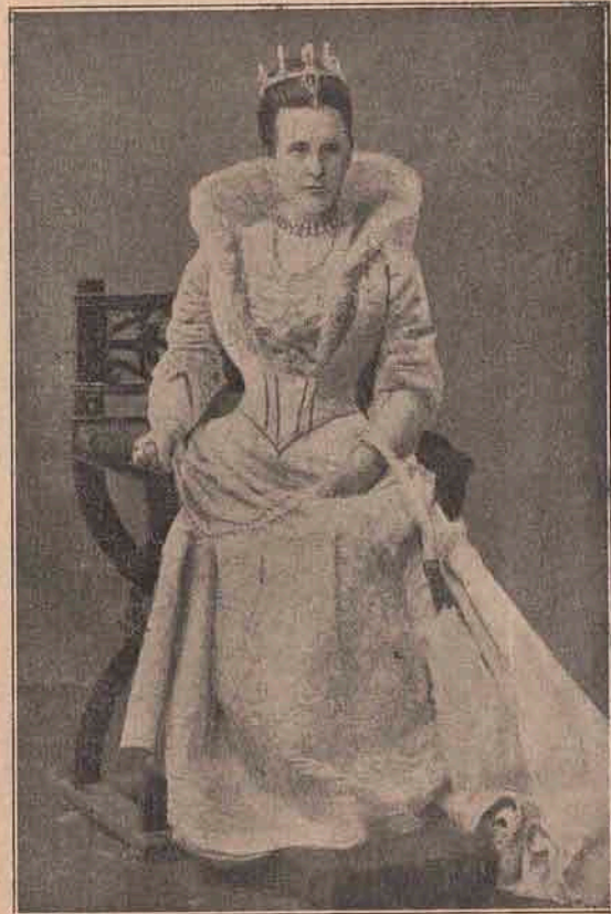
Olga, regina văduvă din Grecia, născută din familie rusască. E fata marelui duce rus Constantin, născută în 28 August 1851. Se cununase cu regele George în 15 Octomvrie 1867.

ne căutăm dovezile în noaptea vremurilor. (Întorcându-se cătră criminal). Am să-ți pun o întrebare; ia bine seama la ce îmi vei răspunde.