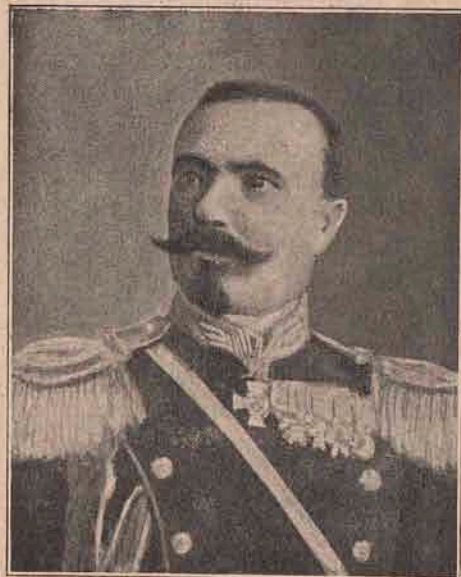
Generalul bulgar Ivanov, care a cucerit Adrianopolul.