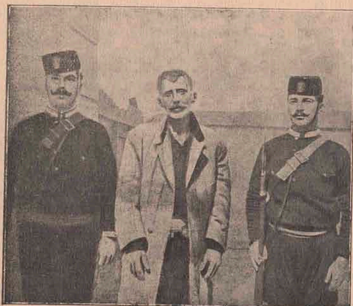
Ucigașul regelui Greciei, care în Salonic a curmat zilele domnitorului George, cu un glonț de revolver.