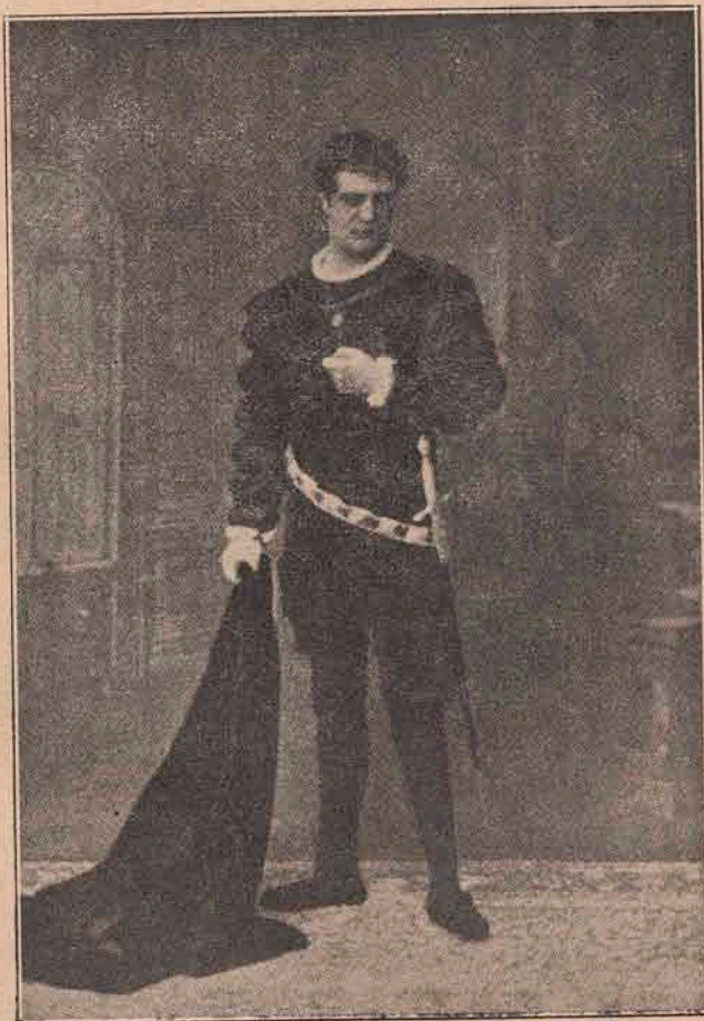
Grigore Manolescu în „Hamlet“.

Manolescu prin voința și geniul său neîntrecut, a luptat să ridice teatrul românesc la un nivel artistic