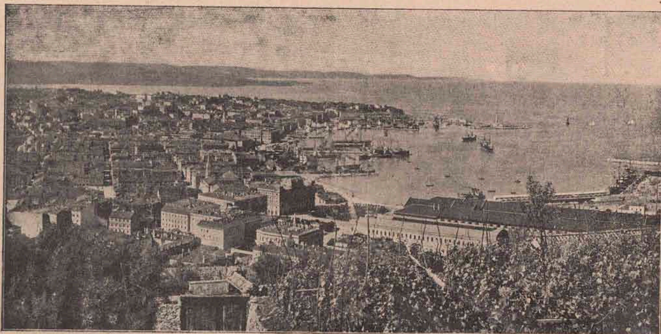
Vederea generală a orașului Triest.