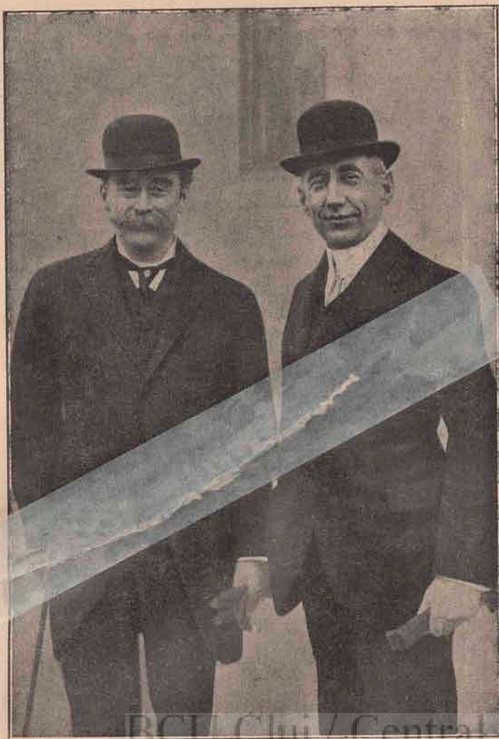
Cei doi descoperitori ai polurilor: Peary, descoperitorul polului nordic și Amundsen, descoperitorul polului sudic.

găminți. Și a și dat ordin omului de încredere, ovreiașul acela slab care a fost la sechestru, să mă mai lase câteva zile“.