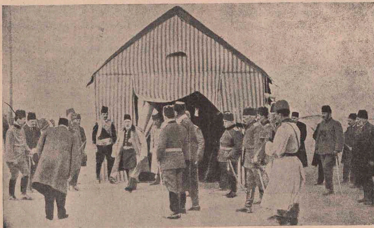
Cortul de războiu al sultanului, pe care l-a dăruit Turcilor tineri în semn de simpatie. Sultanul tocmai iese din cort urmat de noul vizir: pașa Mahmed Sefket.

Părerea generală este, că grupa Pleiadelor formează un sistem enorm de nebuloase subțiri, în mijlocul căruia se află grupa de stele, din cari unele sunt înfășurate, la rândul lor, în neguri mai dese. În-