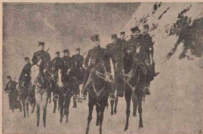
Cavalerie sârbească printre munții din Albania.

Iar a doua zi, când Eliezar deschise ușa casei sale, el văzu în îngustul canal din Ghetto o barcă încărcată cu saci și locuită de o mică figură de lemn