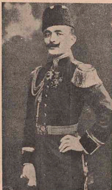
Enver bey, conducătorul Turcilor tineri, cari au răsturnat guvernul turcesc mai deunăzi, ca să nu cedeze Bulgariei Adrianopolul. Enver bey e totodată și comandantul unei alese trupe de soldați, cu care a câștigat câteva învingeri asupra Bulgarilor.

— Sunt mai cuminte ca toată tabăra laolaltă, inclusive dansatoarele.