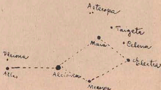
Numele stelelor principale din Pleiade.

De mii de ani, preoții din Orient și Accident, dela miază noapte și miazăzi, din Iaponia la Iberia și din Scandinavia la Africa, le-au cântat și invocat.