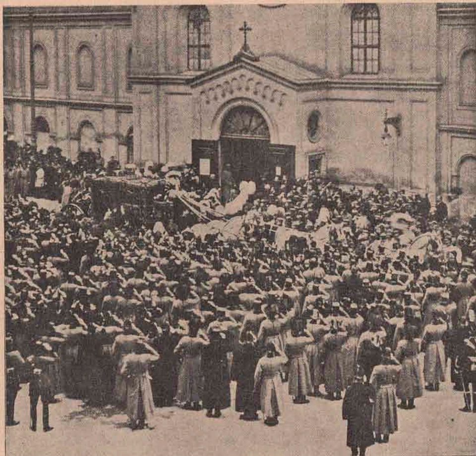
Instantaneu dela îngropăciunea arhiducelui Rainer: Cortejul funebral ajungând la cripta Capuținerilor.

După ce privi rând pe rând cu un ochiu subtil, pe negustorul creștin, pe Madona și pe Copil, Eliezar închină capul și răspunse că primește cauțiunea. Îl duse pe Fabio în casa sa și îi numără cinci sute de ducați bine cântăriți.