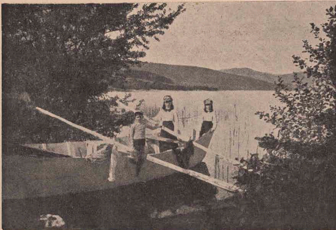
Copiii familiei regale italiene: principele de coroană Humbert cu principesele Iolanda și Mafalda, pe lacul Bracciano în Campagna.

Chinezii, Caldeenii, Egiptenii le-au remarcat, numit și observat cu mii de ani înainte de Cristos. Iov le citează (cap XXXVIII, 31) în secolul al șeptesprezecelea, Homer și Hesiod în al nouălea a. Chr. Eudoxus, Eratosten și Anaximandin le combinau în o constelație separată de a Taurului. Aratus, un interpret al lui Eudoxus, le dă și numirile: „Electra, Alcione, Celaeno, Taygeta, Sterope, Merope și Maia. Aceste sunt ficele lui Atlas, în număr de șapte, dar nu vedem decât șase. Totuș nici a șaptea nu poate fi percută, căci nici o stea nu se perde“.