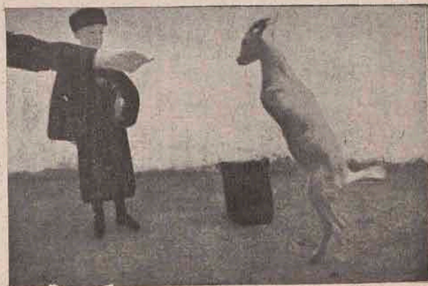
Din minunile naturii: O capră, care nu are numai două picioare.

Când oamenii cei răi se depărtară călare, Săgeata apei pătrunse împreună cu oamenii regelui în sat, liberă pe cei prinși și pe tatăl, pe mama și pe sora lui,