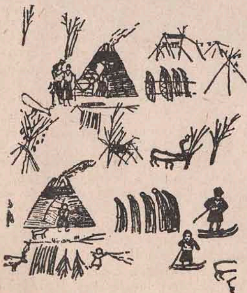
Un sat de laponi.

— Dacă vor năvăli asupra noastră, ne vom lupta cu ei.