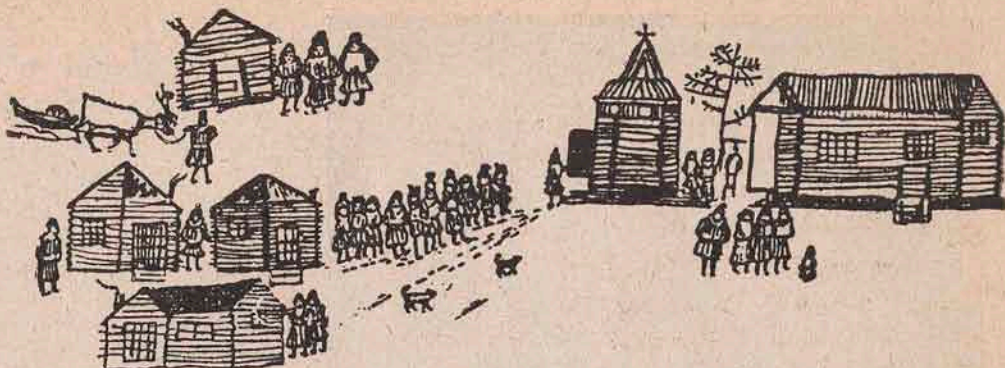
Decor și scene junimare din viața Laponilor.

de până acum — inepuisabilă. Nimic nu împiedică acțiunile radiului, nimic nu le-ar putea sistă chiar, și pe lângă tot lucrul său multilateral n-a arătat nici cea mai mică pierdere, ce am fi putut-o întregistra. Fără îndoială deci, că pământul a căpătat la naștere o cantitate suficientă de radium, în temeiul căreia își poate lupta zilele fără a atacă vr'odată capitalul.