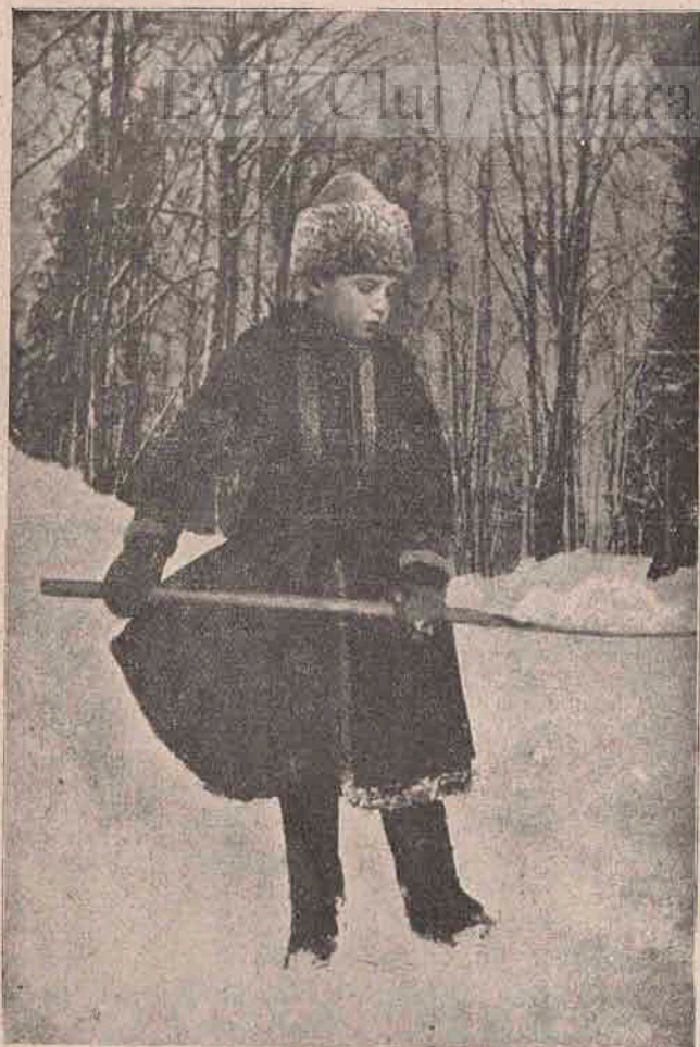
Alexis, moștenitorul de tron al Rusiei, care a fost rănit foarte grav de un anarhist, ce ajunsese în serviciul curții rusești. Curtea domnitoare, ca să curme zvonurile ce se răspândiseră despre micul moștenitor, că adevărat ar fi fost rănit de moarte, l-a fotografiat în iarna asta în parcul palatului, jucându-se cu zăpadă.