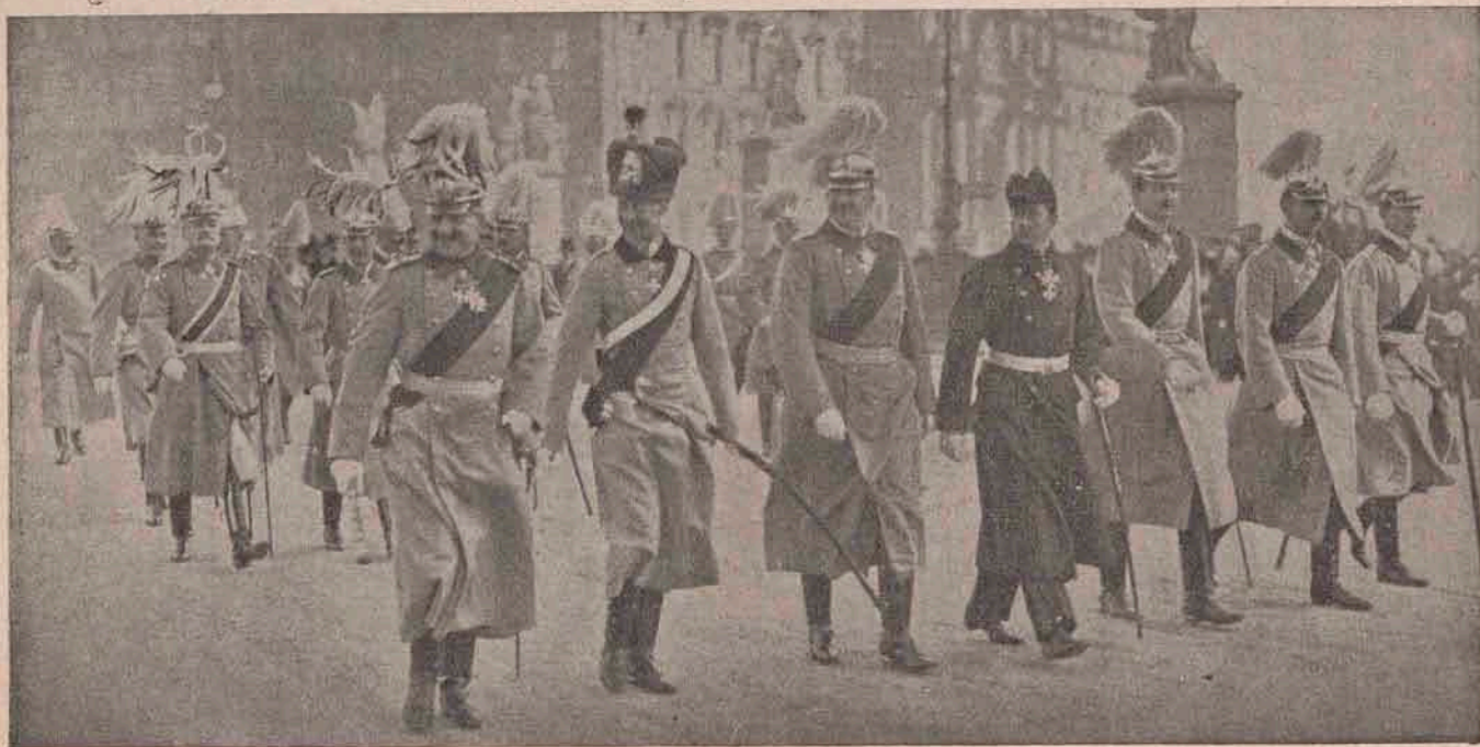
Împăratul Germaniei cu cei șase feciori ai săi, la sărbătorile dela anul nou. Împăratul e cel din stânga. Lângă el spre dreapta e moștenitorul de tron al Germaniei.

El observă însă din povestirea lui Săgeata apei