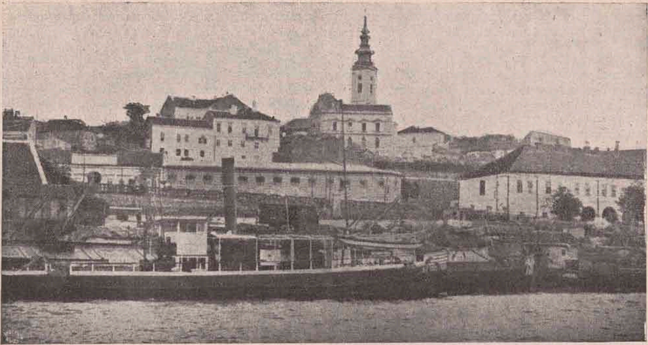
Belgradul, capitala Sărbiei.