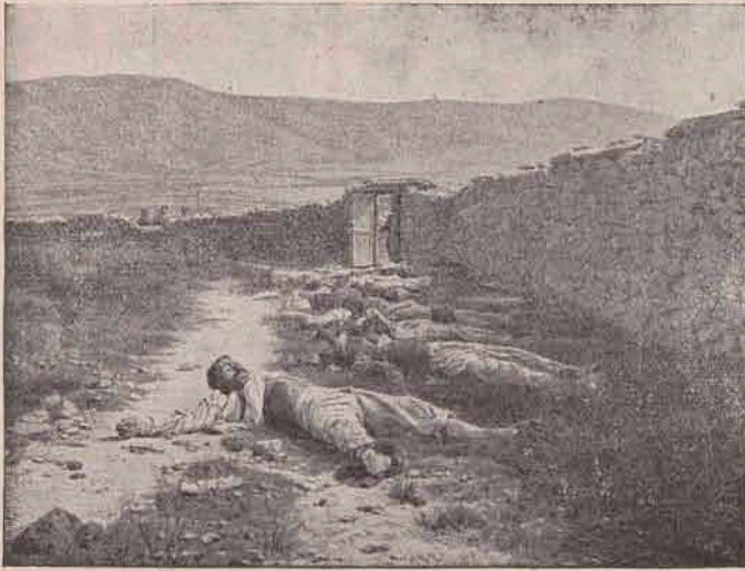
Tărani creștini uciși de Turci în Macedonia.

care ni-ar impune-o necesitățile politice și să ne aducem aminte — dacă am putut uita vreodată — cine suntem și cine sunt adversarii armatelor creștine din Balcani. Sau mai bine zis, să-i lăsăm pe streini să ne amintească acest lucru, cu o imparțialitate de care nimeni nu s-ar putea îndoii. Acesta este chiar scopul articolului de față.