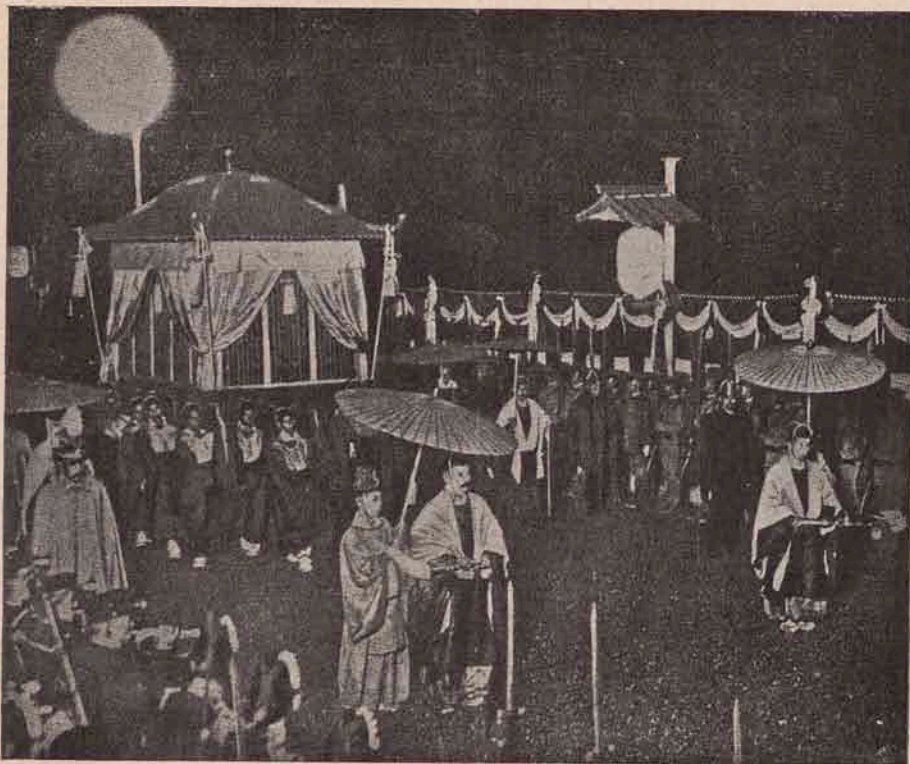
Îngropăciunea împăratului Muciuhito, al Japoniei. Chipul nostru arată scena când coșciugul împăratului e dus la groapă în jalea întregului său popor credincios.

ecstraordinară o favorizează în mare măsură și faptul, că în toamna premergătoare se gunoiește bine terenul, iar imediat înainte de sădire se repetază îngrășarea cu gunoiu lichid, ceea ce face ca oamenii să ocolească pe departe astfel de locuri.