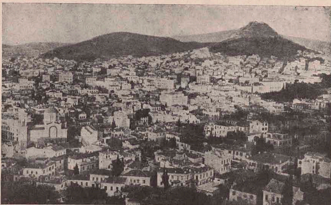
Atena, capitala Greciei. Vedere generală luată de pe Arcopolis.

Și nici azi nu știu, dacă cuminte am făcut, că în vârsta de șase ani am abzis deja de gândul de-a fi soldat, căci de-atunci încă niciodată nu mi-a mai trecut prin cap, să mă fac cătană. Regret par'că puțin. Purtatul armelor e o ocupație foarte nobilă. Datorința soldatului e clară și cu atât mai hotărâtă, că nu judecata o hotărește. Omul acela, care ar judecă, că a făcut bine, ori nu, repede află, că între faptele sale numai foarte puține sunt nevinovate. Preot sau soldat trebuie să fii, ca să poți rămâne liber de grijele îndoielilor.