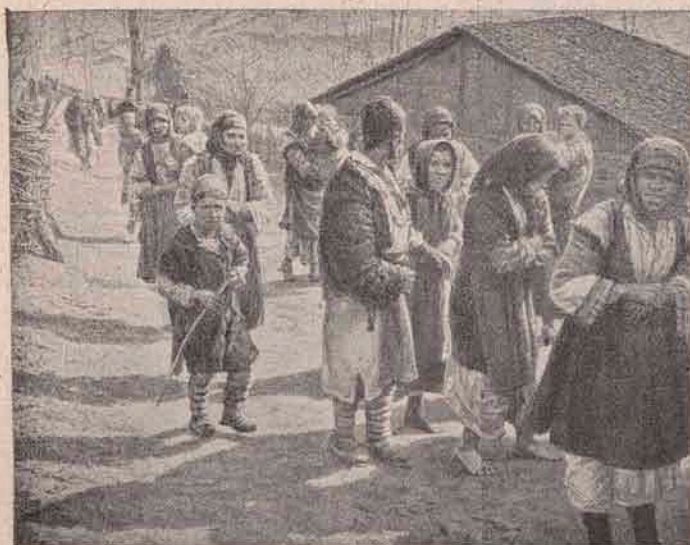
Tărani creștini rămași pe drumuri pe o iarnă cumplită, după ce Turcii le-au pustii și ars satul.

În regiunea Üsküb au fost comise, în cele dintâi șase luni ale anului 1902, nu mai puțin de 200 de asasinat cunoscute , ceea ce de fapt putea fi a cincea parte a asasinatelor reale cari au avut loc acolo.“