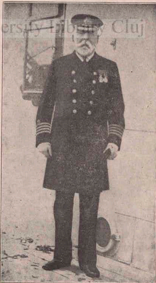
SMITH, căpitanul vaporului Titanic. Smith în clipele inspăimântătoare ale cufundării a dovedit o bărbăție rară și a rămas cel din urmă pe uriașul vapor care s-a cufundat.

Cu apropierea iernii, ori-unde se află astăzi o mână de Români din clasa cultă, în orașe sau pe sate, se încep sfătuirile, discuțiile, se stabilește programul sărbătorilor culturale, concerte, producții teatrale, conferințe, și tot ce numai se poate înjgheba. Trăind în cele mai multe cazuri în mijlocul străinilor, — căci aproape nici un oraș nu se poate numi al nostru, cu alte preocupări decât ale noastre, cu alt suflet și altă cultură, — intelectualii nostri simt tot mai mult necesitatea, de-aș închegă rândurile, de-aș contopi viața prin mijlocirea aceleiași culturi românești. Și cum nicăiri și niciodată ajutorul statului nu vine pentru acest scop, intelectualii