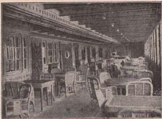
Cafeneaua de pe vaporul Titanic.