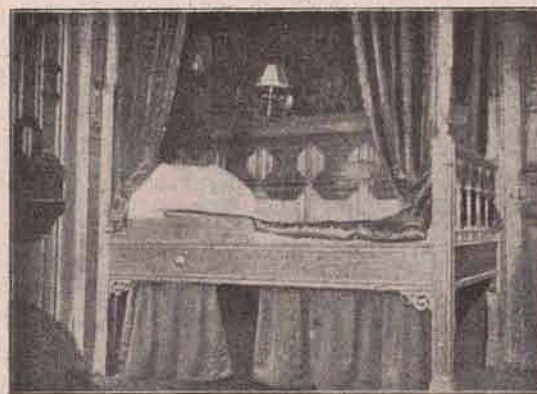
Cabină de durmit de cl. I. pe vaporul Titanic.

Crăciun, se hotărîse numai decât să-și dea concursul. Ea mai cântase și în orașelul său de provincie. Iar acum, cu zilele scurte de toamnă, cu vânturile reci, putea face puține schimbări, și începea să se gândească cu ce să-și treacă vremea.