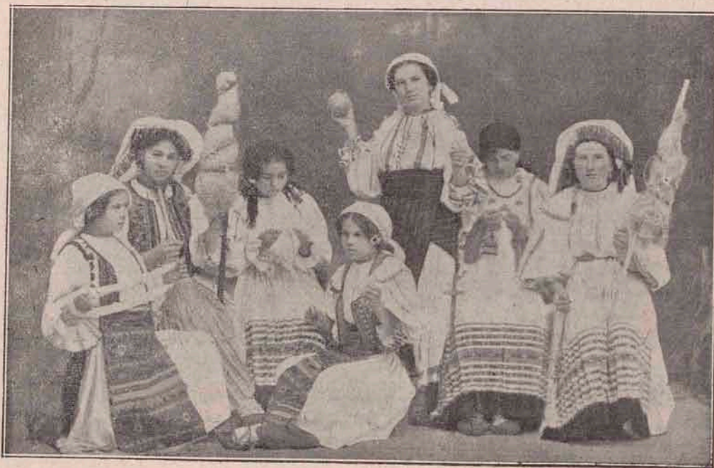
Vedere dela atelierul de țesături din Orăștie:

„Nu te amestecă în trebile altora, Prodane.