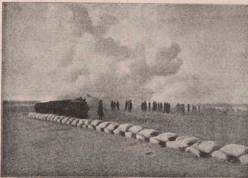
Din războiul italo-turc. Artileria italiană în lupta dela Benghazi, când oastea Turcilor a fost nevoită a se retrage.

După doi ani, — sub țaseala regulată și îngrijirea