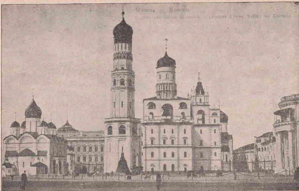
Marea biserică catedrală din Moscova. Din turnul principal al acestei biserici a privit Napoleon cel Mare cum ardea Moscova, când ajunsese el la ea. La poalele turnului e un clopot uriaș, doar cel mai mare clopot din lume. Se trage numai în ziua când se încoronază un țar nou.

De prisos să mai spun, că am petrecut minunat de bine, că nașul copilului a spus isprăvile lui când eră sergent la pompieri, cum ardea o casă și el s-a suiat pe coperiș și a căzut în pod, din pod în casă în paful unei cucoane care eră culcată, lucru care l'a spus cu oarecare semn că eră minciună glumeașă.