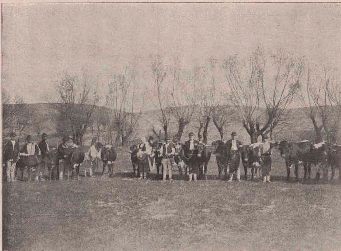
Vedere dela expoziția de vite din Săcel (lângă Selțiște) arangeată în toamna trecută de „Reuniunea română agricolă din comit. Sibiuului”. Țărani români cu frumos îngrijitele lor vite.

Acelaș cânt al pustiirii Ce-l plânge pânza pe catarg, Când fulgerele tae cerul Și încep furtunile în larg.