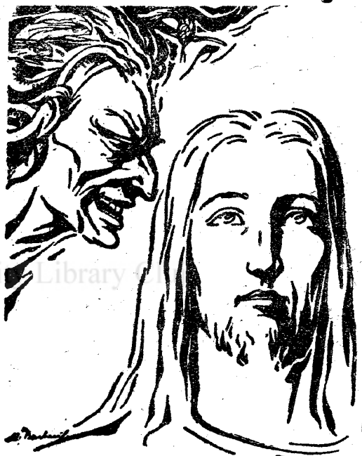
Satana îndrăznește a ispiți pe oricine, chiar și pe Mântuitorul!