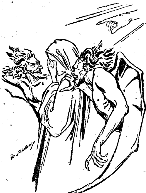
În râset satanic, fetele și plânge deznădăjduit nensultarea de glasul Evangheliei