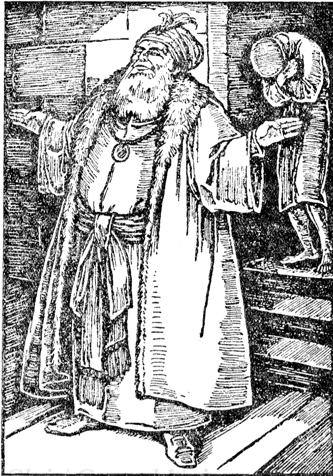
Două feluri de oameni și două feluri de rugăciuni între care ești?

la cer, prin aceea că se întrepune zilnic pentru noi la Părintele ceresc, ca să ne erte pentru păcatele noastre cele multe. Da! Lui Isus Hristos