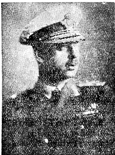
M. Sa Regele Carol II. înfăptuitorul României celei noi