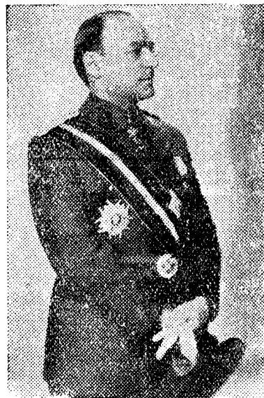
D-l. primministru Armand Călinescu, eredinclosul sftetic al M. Sale Regelui Carol II, a împlinit zilele acestea 46 ani de viață

Bunul Dumnezeu să țină tare și sănătos pe regele țării, dăruindu-i înțelepciune și pricepere în toate lucrurile.