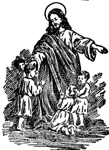
Lăsați copii să vină la mine!

El vă strigă să veniți în jurul lui ca să vă așeze inimile în inima lui. Dar pe cei răi nu-i primește! Prin urmare