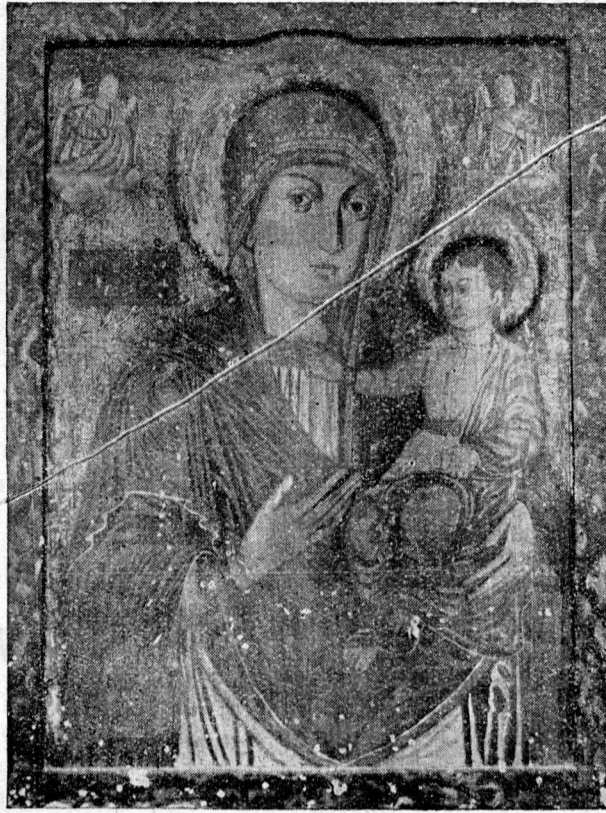
Icoana făcătoare de minuni dela Nicula

spre biserică unii din evlavie alți din curiozitate. De fapt s'a constatat că era o minune adevărată. Biserica era tixită de credincioși ce nu mai conțineau cu rugăciunile, sporite mereu de