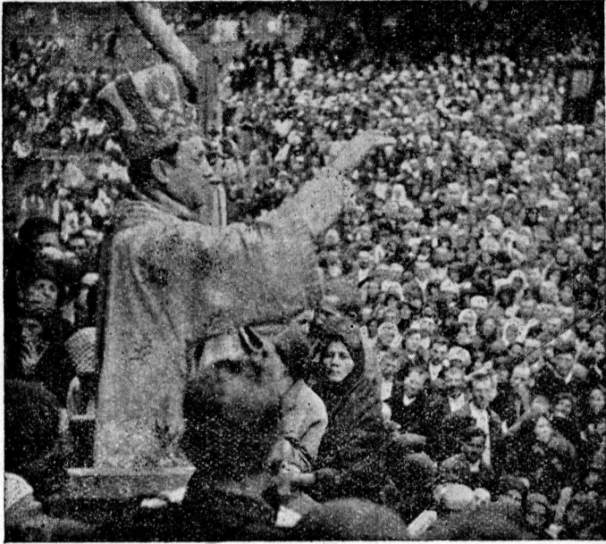
Excelența Sa Episcopul predicând mulțimii la Nicula

Satul Nicula cu vestita mănăstire ce îi poartă numele, a ajuns cunoscut în întreg Ardealul. Este așezat la câțiva kilometri de orașul Gherla, în județul Someș. Din Gherla urcând un deal se vede satul în fundătura unei văi destul de adânci, împrejmuit de dealuri înalte cu pământ galben