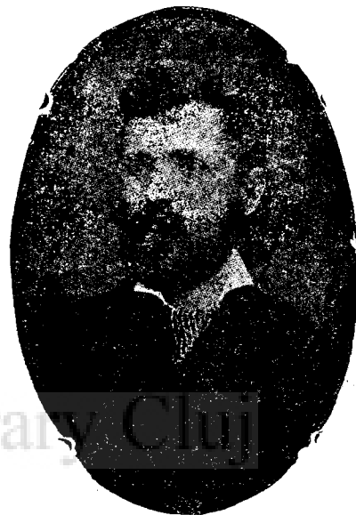
Ion Popu Reteganul n. 1852 † 3 Aprilie 1905.

Asociațiunea pentru cultura poporului român a luat o inițiativă care merită toată lauda și anume de a publica în „Biblioteca populară” a ei cărțile lui I. Pop Reteganul, care este unul dintre cei mai buni scriitori pentru popor. Asociațiunea deja a și tipărit o carte intitulată: „Casa țaranului român, sfaturi de I. Pop Reteganul.” În aceasta carte țaranul nostru va găsi tot ce este necesar pentru a lupta în viața aceasta. Din prilejul acesta se cuvine se evoc puțin personalitatea acestui distins poporanist.