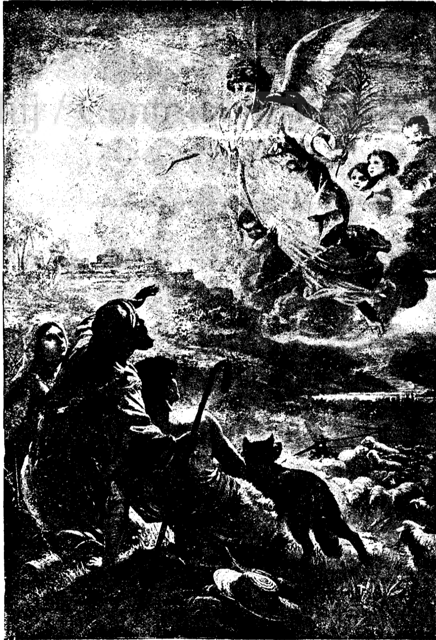
Corul ingeresc anunțând păstorilor vestea de salvare a omenirii

Cu astfel de perspective viitorul omenirii se anunță întunecat. El rezervă lumii perioade de fer și mai groaznice decât cele cunoscute până acum în istorie. Dacă în adevăr toate acestea s'ar produce și dacă nu s'ar ivi omul care să-i scoată pe oameni din nebunia lor și să-i salveze din starea actuală de egoism și mândrie desăvârșită atunci cu adevărat am putea spu-