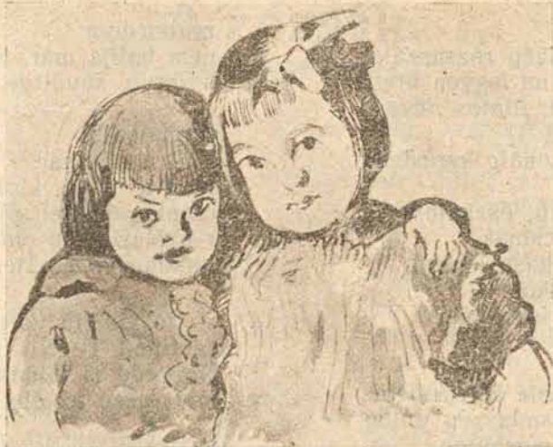
Dóczyné, Berde Amál rajza.

Bujj, bujj, összebujjatok, Egymásra boruljatok,