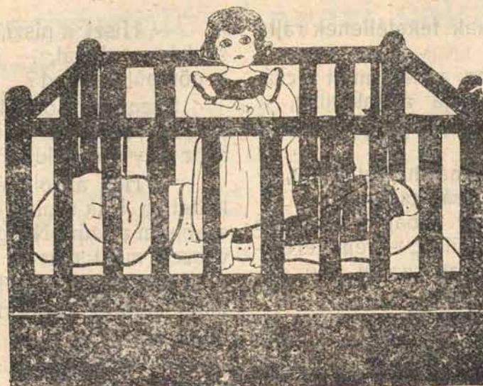
Azzél Sári rajza.