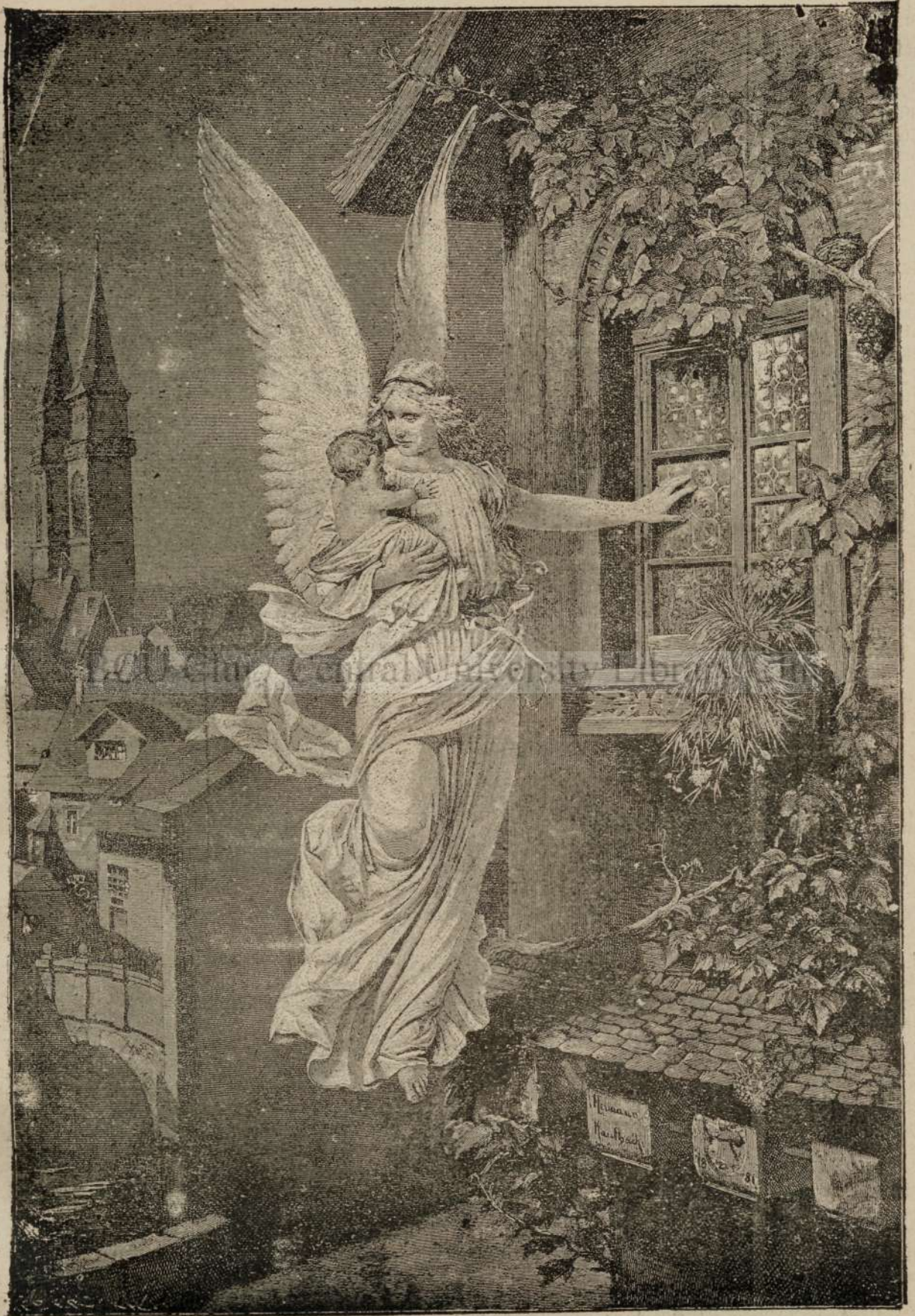
Pe calea vecinicii.