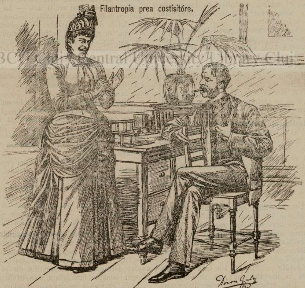
Filantropia prea costisitoare.

Despre redactarea Cóloru de Carte Funduala sêu nóua Carte funduala tradusa si esplicata in limb'a româna dupa textulu oficialu originalu de Pavelu Rotariu advocatu in Timisióra. Pretiulu 30 cr. Se póte procurá dela dlu auctoru. — O recomen-damu tuturoru acelor'a pe cari i intereséza, fiendu lucrata într'unu modu cátu se póte mai practicú pentru usulu comunu.