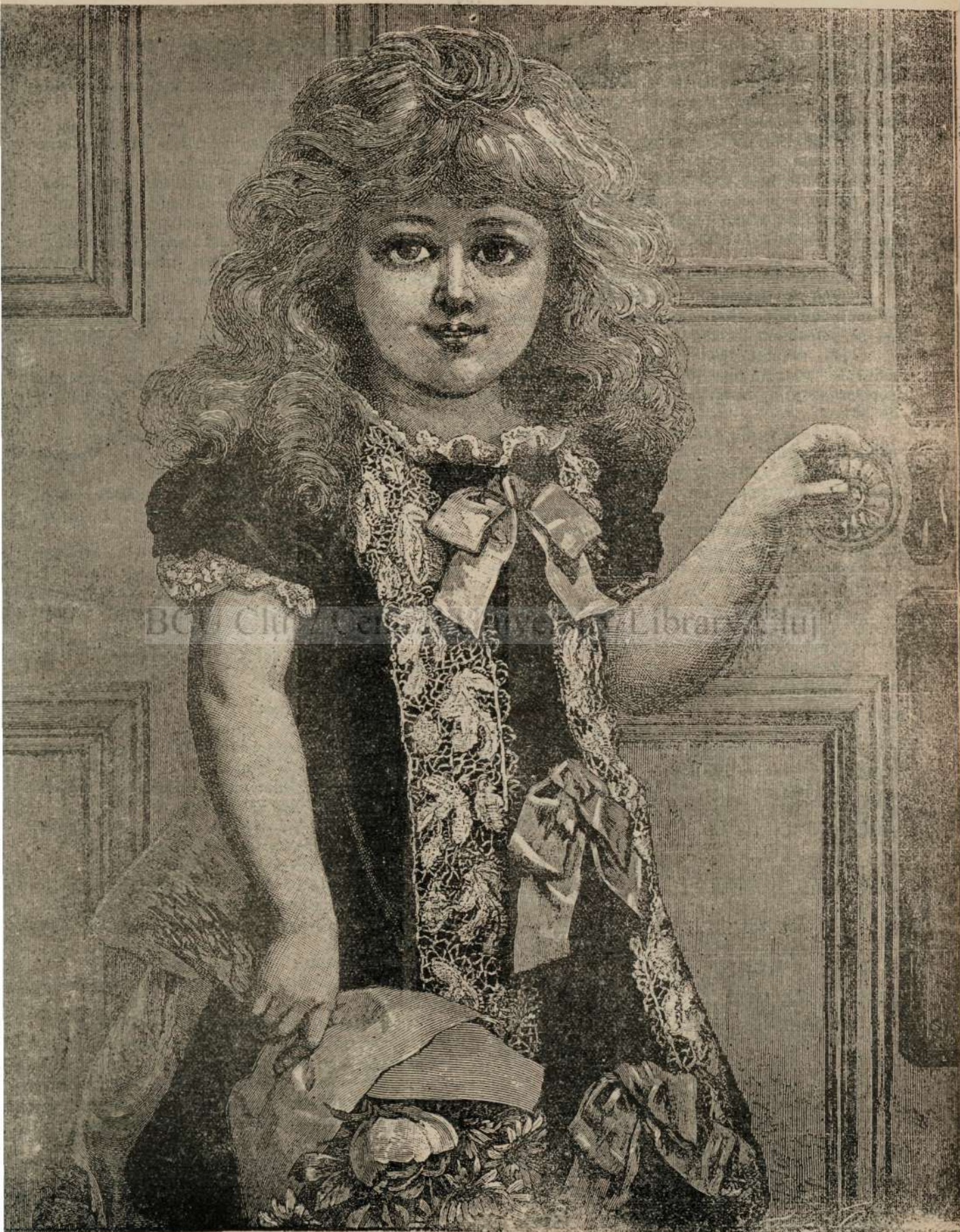
Diu'a onomastica — la multi ani!