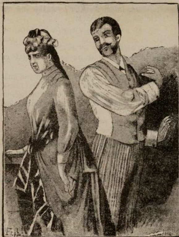
— Ba-i alba. — Ba-i négra.