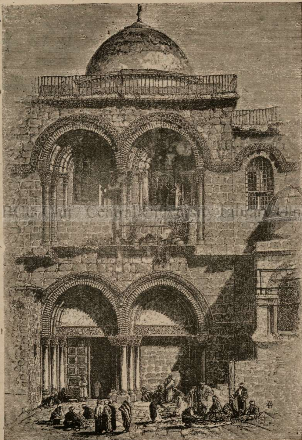
Capel'a Santului mormentu in Jerusalimu.