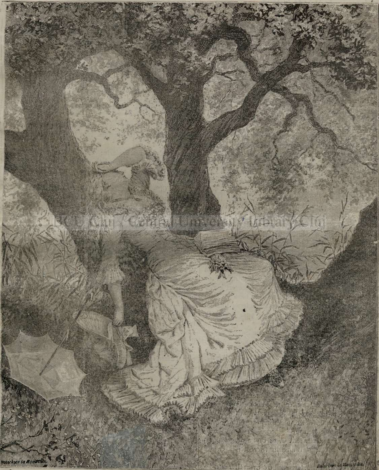
La umbr'a arboriloru.