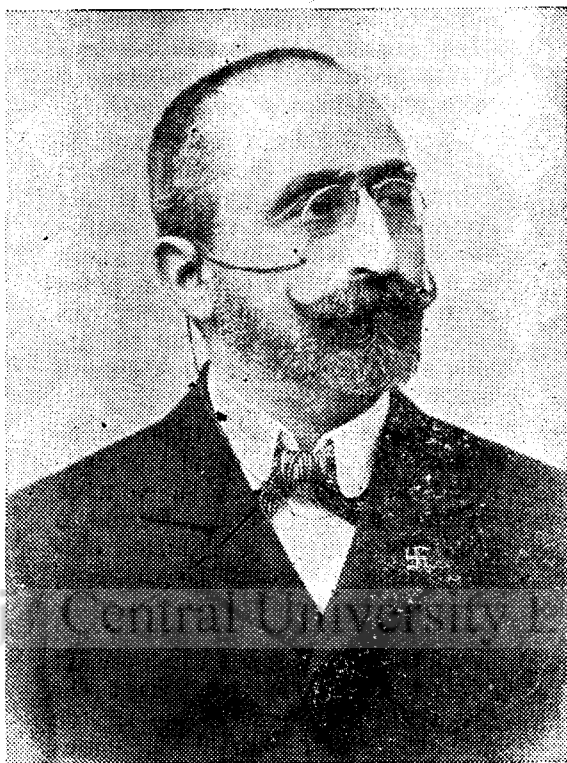
A. C. CUZA

Marele Apostol al Neamului Românesc. Luptătorul neînfricoșat al Naționalismului integral-creștin atacat mișelește de jidani în ziua de 1 August la Iași.